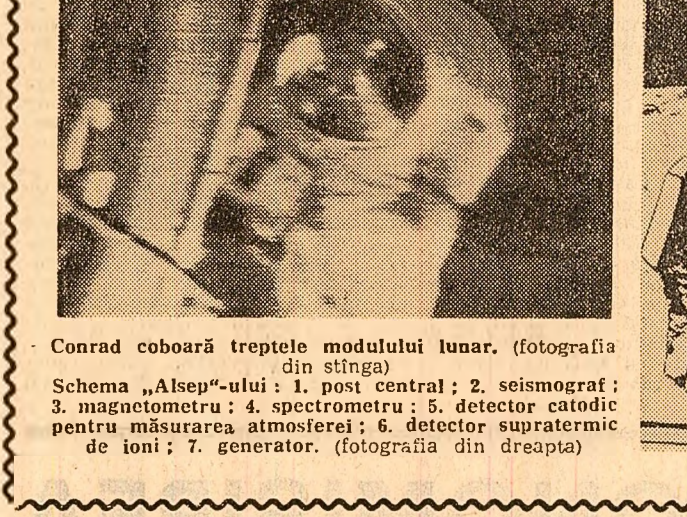
Conrad coboară treptele modulului lunar. (fotografia din stînga)

„Contactul este ușor. Contactul este ușor. O.K. Motorul a fost oprit. O.K. E senzațional, băieți!”