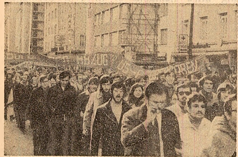
Frankfurt pe Main (Republica Federală a Germaniei). Demonstrație împotriva continuării războiului dus de S.U.A. în Vietnam. Participanții au cerut retragerea imediată a tuturor trupelor americane de pe teritoriul Vietnamului de sud.

mod serios intrarea Marii Britanii în Piața comună”, a declarat cancelarul R. F. a Germaniei, Willy Brandt, într-un interviu acordat ziarului „Observer”. Willy Brandt a subliniat că data începerii negocierilor privind aderarea Angliei la C.E.E. nu este problema cea mai importantă, ceea ce contează este de a se hotărî începerea acestor discuții. El a relevat că problema admiterii de noi membri în cadrul Pieței comune este strins legată de cea a soluționării unor anumite chestiuni privitoare la politica agricolă comună.