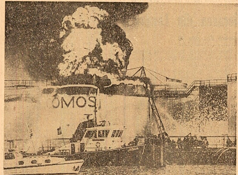
În portul olandez Amsterdam a explodat un petrolier încărcat cu 1,5 milioane litri de petrol. Incendiuul a durat mai multe ore. În fotografie: Petrolierul în flăcări

Curtea marțială din Seul a pronunțat sentința de condamnare la moarte împotriva a doi militari din armata sud-