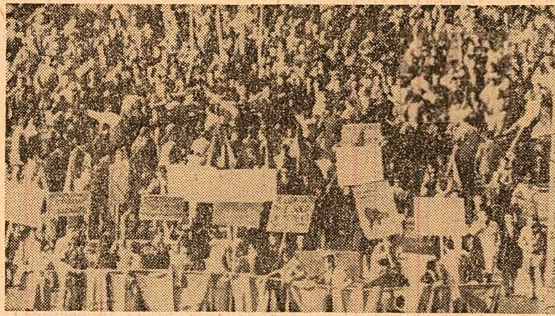
Dupa citeva luni de acțiuni revendicative la locul de muncă, de manifestări și greve metalurgice din întreaga țară au organizat vineri, la Roma, un mars prin care și-au exprimat din nou cerința de a li se rennoi contractele colective de muncă, expirate de năis multă vreme. Ziarii „L'Unità” consideră acțiunea metalurgicilor ca pe „o mare victorie a oamenilor muncii, o victorie politică, de o inestimabilă valoare, a sindicatelor și a clasei muncitoare”. În fotografie: aspect din timpul manifestației