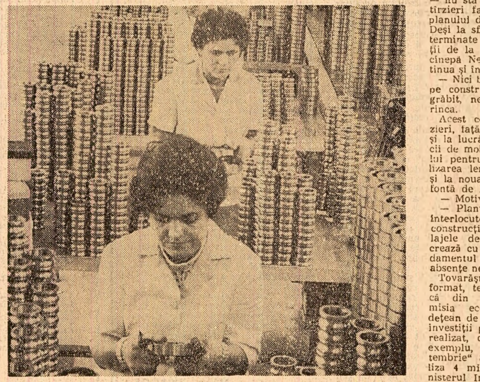
Intr-una din secțiile Fabricii de rulmenți din Birlad.