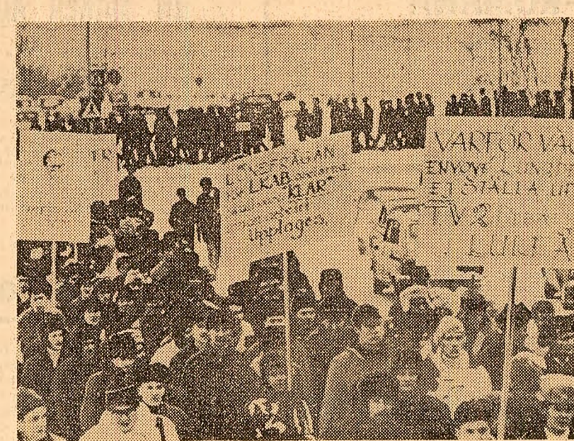
Greva celor 5 000 muncitori suedezi de la minele de fier din Kiruna continuă. În fotografie: demonstrație organizată de greviști în sprijinul revendicărilor economice. După cum se știe, minierii au început acțiunea lor revendicativă la 9 decembrie, în semn de protest împotriva măsurilor drastice de raționalizare preconizate de administrația minelor, precum și împotriva nesatisfacției doleanțelor lor la încheierea unui nou contract de muncă.

WINTERTHUR 22 (Agerpres). — La tribunalul din Winterthur (Elveția) a luat sfârșit procesul întentat membrilor grupului de comando palestinian care, la 18 februarie 1969, a atacat cu focuri de armă un avion al companiei aeriene israeliene „El Al” pe aeroportul din Zurich, răbind mortal pe unul dintre piloți. Curtea cu jurati i-a condamnat pe cei trei inculpați la cîte 12 ani închisoare.