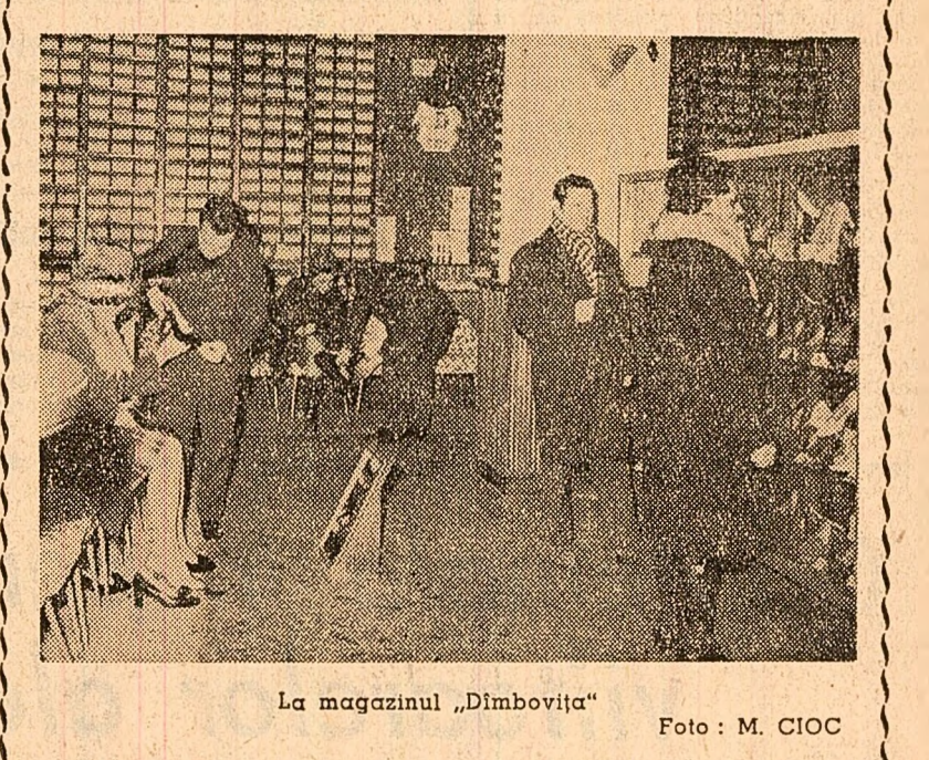
La magazinul „Dimbovița”

gazinele „Dimbovița” din Calea Victoriei 20, și „Antilopa”, pe șoseaua Ștefan cel Mare 5 (bloc „Dinamo”; la „Clujeanca” din Cluj (Plăcuța 1 Mai 4-5); „Banatul” din Hunedoara (Bd. „Dacia”, 1, bloc G. 3); „Olimpia” din Oradea (Calea Republicii 5); „Vida” din Oradea (str. Alex. Petőfi 1); „Fabrica de mînuși” din Tg. Mureș (str. Postel 1) și „Banatul” din Timișoara (Bd. Tineretii 2).