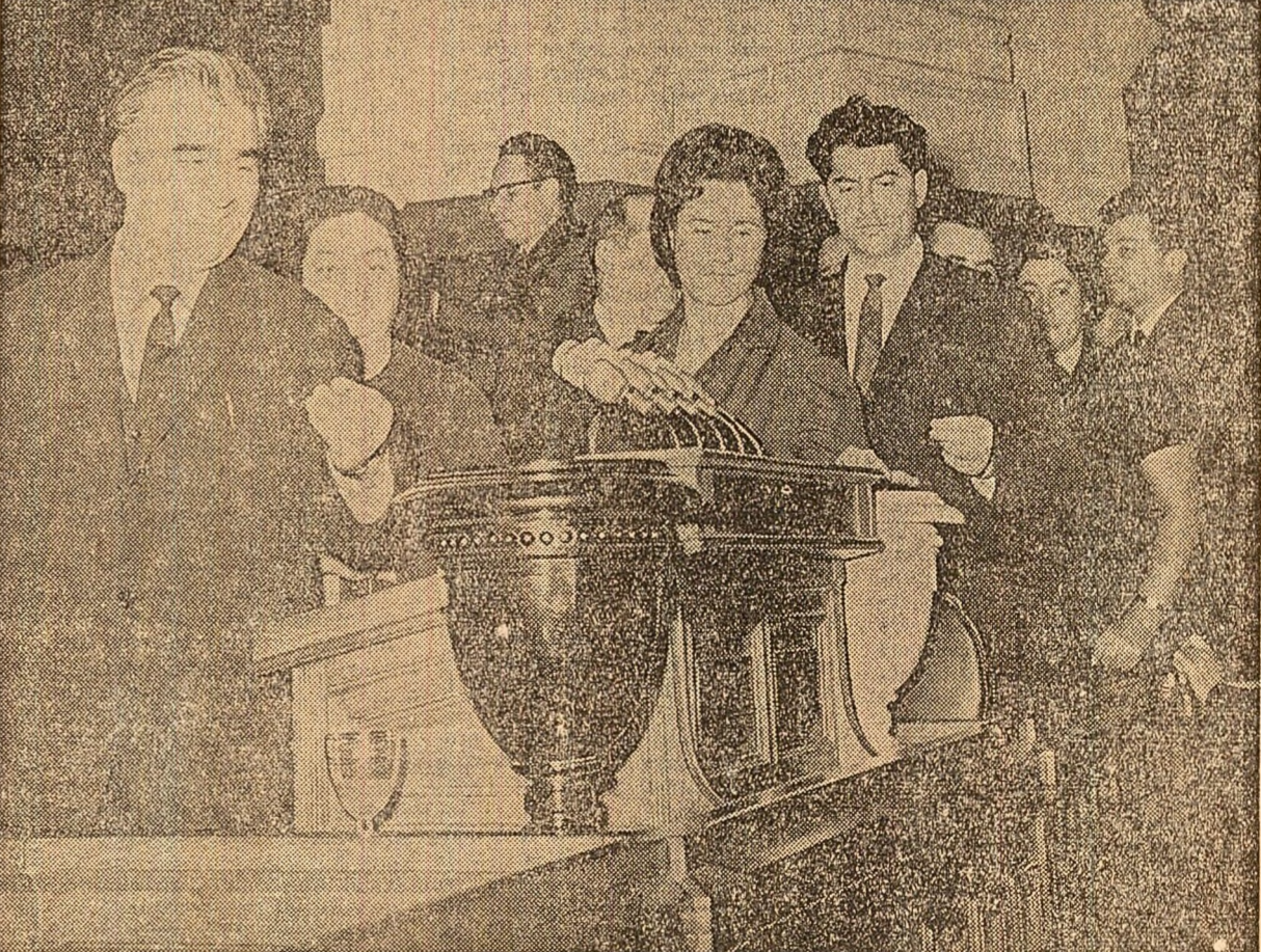
În timpul votării