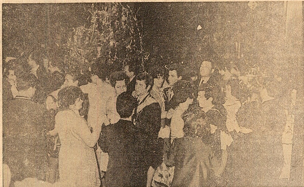
Un loc între zeci de mii. Revelionul a fost bogat sărbătorit între frunzișurile țării. (În fotografie: aspect de la restaurantul „Cîșmigiu” din București)

1970 PRIMIT CU OPTIMISM PE PĂMÎNTUL ROMÂNIEI SOCIALISTE