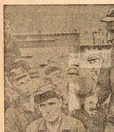
Începutul la 9 decembrie, în semn de protest împotriva măsurilor drastice preconizate de administrație, greva celor 5000 de muncitori suedezi de la minele de fier din Kiruna continuă. În fotografie: un mingal al greviștilor în care aceștia și-au redat hotărârea de a nu relua lucrul pînă la deplină satisfacere a revendicărilor lor

Circulația a fost din nou pusă în dificultate vineri în capitala Italiei și în mai multe orașe ale peninsulei, datorită grevei lucrătorilor din transporturile în comun. La Roma, aceștia au oprit mijloacele de transport în comun în două reprize: prima oară timp de trei ore, în cursul dimineții, iar a doua oară, cu aceeași durată, după-amiază. Lucrătorii din transporturi cer încheierea unui nou contract colectiv de muncă, întrucât vehiculul contract a expirat cu peste nouă luni în urmă. Ei vor declara o nouă grevă săptămâna viitoare. De asemenea, funcționarii de la percepții au încetat lucrul, creând o serie de dificultăți acestor servicii într-o perioadă în care trebuia încheiată campania de strângere a impozitelor pe anul care a trecut.