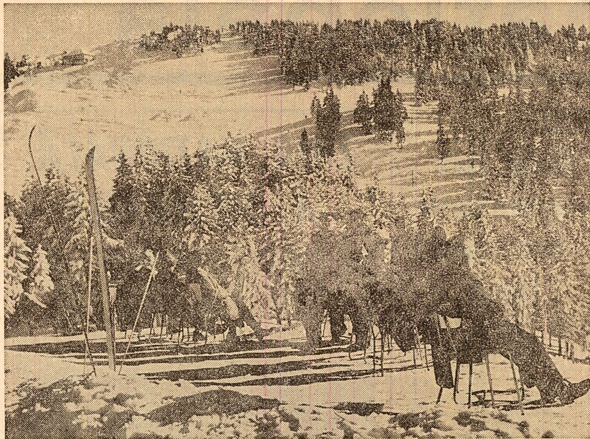
După un drum pe potecile însoțite, un binevenit popos pe... Postăvarul

Rubrică redactată de Ștefan ZIDARITA Gheorghe DAVID cu sprijinul corespondenților "Scînteii"