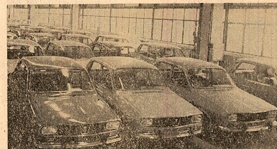
Un nou lot de autoturisme „Dacia 1300” va rula curînd pe șoselele țării.