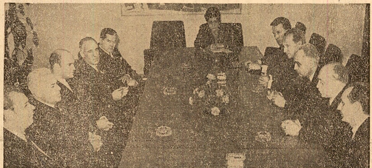
În timpul vizitei protocolare