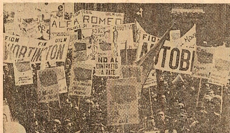
Demonstrația a muncitorilor din Roma în sprijinul revendicărilor lor sociale și economice

Au fost luate o serie de hotărîri privind intensificarea colaborării în diverse domenii între industriile petroliere ale celor patru țări. Se prevede, printre altele, coordonarea politicii privind piețele externe.