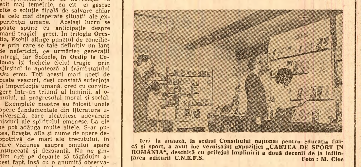
Ieri la amiază, la sediul Consiliului național pentru educație fizică și sport, a avut loc vernisajul expoziției „CARTEA DE SPORT ÎN ROMÂNIA”...