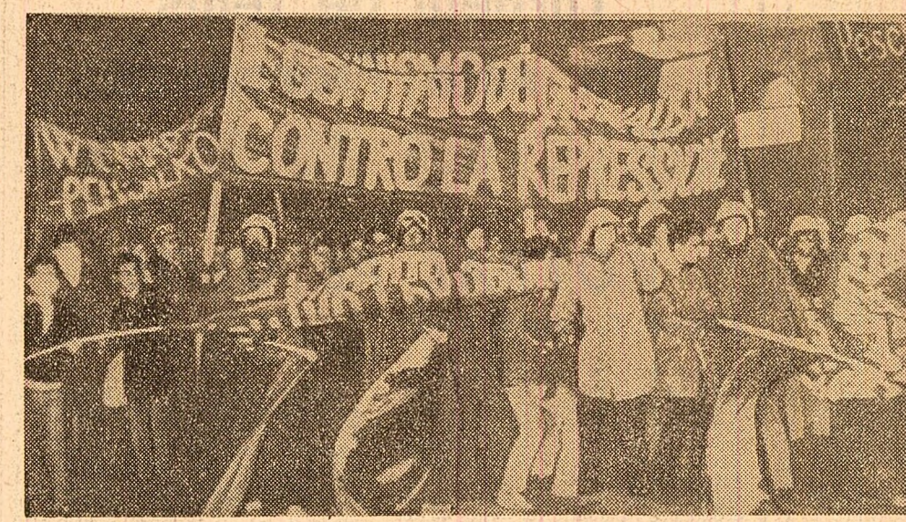
Italia. Demonstrație a muncitorilor din Milano în sprijinul satisfacerii revendicărilor lor