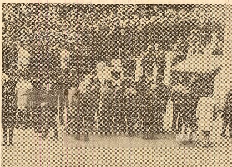
Belgia. Cerind satisfacerea revendicărilor lor, minierii greviști din bazinul Limbourg s-au adunat în fața uzinei "André Dumont", în timp ce intrările sînt pînă de poliție

O informație publicată duminică în coloanele săptămînalului londonez "The People" a provocat o puternică emoție în rândurile cercurilor politice și ale opiniei publice britanice. Știrea a dezvăluit, cu multe detalii, săvîrșirea unui masacr de către trupele britanice în Malaya, în urmă cu peste 21 de ani. Ea se bazează pe declarațiile mai multor veterani de război, participanți direcți la operațiune. Toți aceștia au confirmat că, la 12 octombrie 1948, în satul de junglă Kuala Kubu Bharu, din apropierea capitalei malayeziene, au fost împușcați 25 de muncitori de pe o plantație, suspecți de a fi partizani comunisti. William Cootes, unul dintre foștii membri ai plutonului de execuție, din compania "G" a corpului al doilea din "Scots Guards", a declarat că plutonul primise ordin să dis-