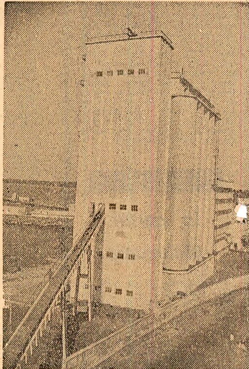
Vedere parțială a Combinatului de panificație din Colombo

În anul care au trecut de la dobîndirea independenței, poporul ceylonez a depus eforturi susținute pentru lichidarea moștenirii coloniale față de imperiul britanic și pentru realizarea unui program de irigații și defrișări, care a dus la extinderea suprafețelor cultivate, introducerea de plantații noi, sporirea producției alimentare și reducerea dependenței față de importuri. Au apărut și primele întreprinderi industriale ceyloneze: fabrica de cauciuc și anvelope de la Kelaniya, fabrica de oțelărie de la Oruwala, fabrica de mașini-unelte de la Jakkola. Întreprinderi pentru prelucrarea trestiei de zahăr etc. Alte obiective industriale — printre care o turnătorie de fontă, un combinat textil, fabrici pentru prelucrarea unor produse agricole — aflate în diferite stadii de construcție, se vor