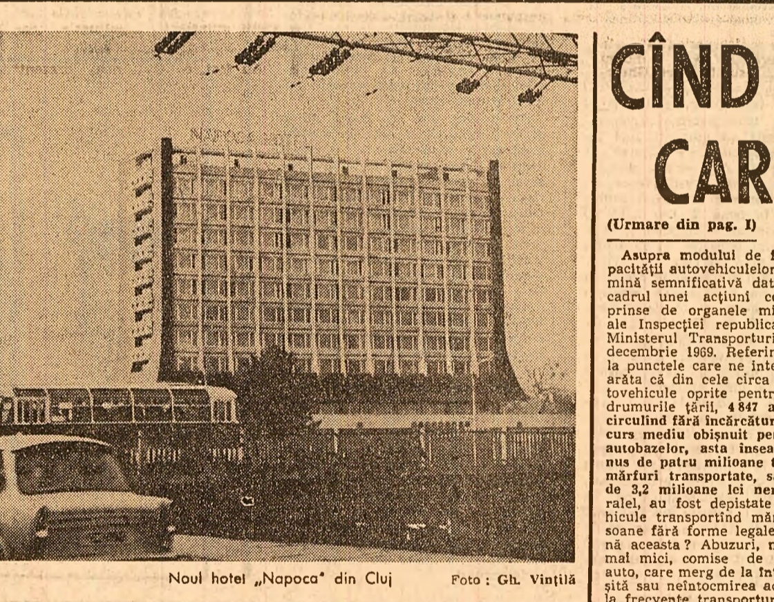
Noul hotel „Napoca“ din Cluj.

— În legătură cu această situație, potrivit anexei VII la H.C.M. nr. 914/968, trecerea dintr-o cooperativă în întreprindere socialistă de stat, nu este suficientă pentru a beneficia de continuitatea în muncă în aceeași unitate. Vă rugăm să ne spuneți, ce prevăd reglementările în vigoare în aceste cazuri.