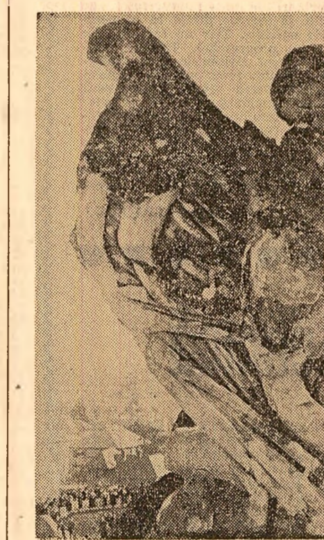
Prin monumentele sale, Alba Iulia invită la o permanentă meditație