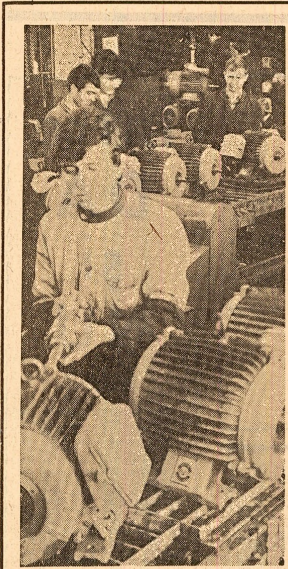
Vedere parțială de la Uzina „Electromotor” din Timișoara. În plan: linia de montaj motoare asincrone. Calitatea și aspectul produselor uzinelor „Electromotor” din Timișoara au fost îmbunătățite an de an, în nomenclatorul ei de fabricație incluzându-se în prezent o mare diversitate de motoare electrice de diferite gabarite și dimensiuni, aspiratoare, ventilatoare de masă etc. În ultima vreme, au fost puse în funcțiune noi linii tehnologice. Uzina timișoreană beneficiază de aportul unor inventatori de prestigiu, care contribuie în promovarea progresului tehnic în industrie. Cu unele dintre realizările importante ale acestei uzine publicul larg a făcut cunoscute la Expoziția realizărilor economiei naționale — 1969.