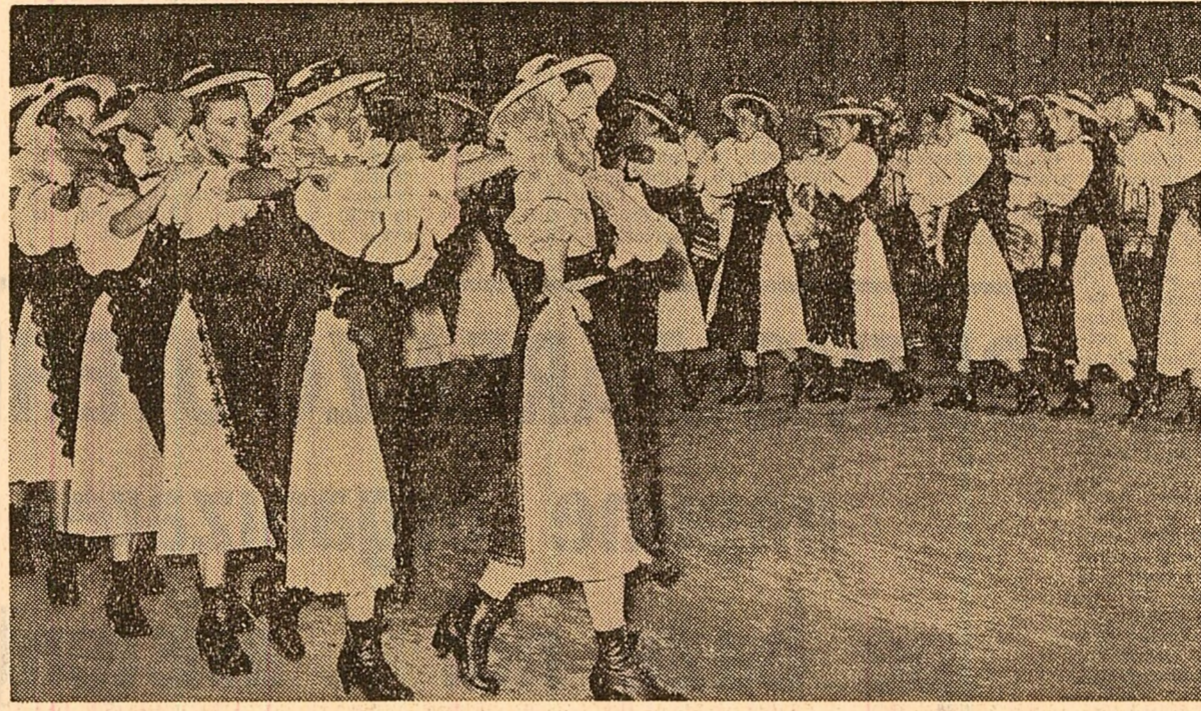
„Dansul fetelor din Căpîlna” — o veritabilă carte de vizită a artei amatoare