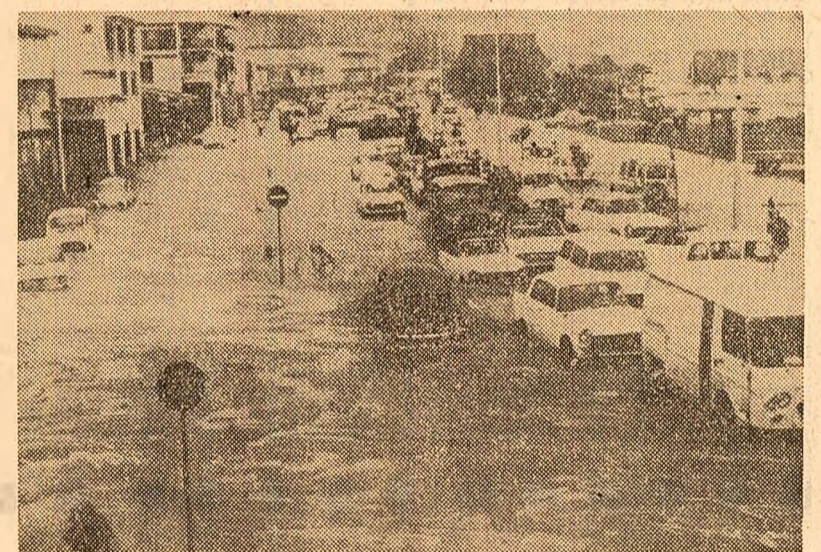
În urma unor plozi torențiale, în insula Tahiti s-au înregistrat mari inundații. În fotografie: una din străzile principale ale capitalei, Papeete

CHANDIGARH 6 (Agerpres). — Starea de tensiune persistă pe teritoriul statului Punjab, ca urmare a hotărîrii guvernului de la Delhi de a accorda statului învecinat, Haryana, orașul Fazilka și o parte a regiunii agricole inconjurătoare, drept compensație pentru includerea orașului Chandigarh în statul Punjab. Astfel, la Fazilka, magazinele nu fost închise vineri, întrucît activitatea fiind paralizată, în semn de protest față de decizia amia, a cabinetului federal. Partidul Akali Dal, principalul partener din coaliția guvernamentală a statului Punjab, a protestat împotriva acestui transfer, deoarece în regiunea respectivă este predominant limba vorbită în Punjab, desfi populația majoritară este de origine hindu, ca în Haryana.