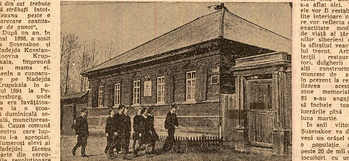
Casa din satul Șuşenskoe în care a locuit Lenin între anii 1898—1900