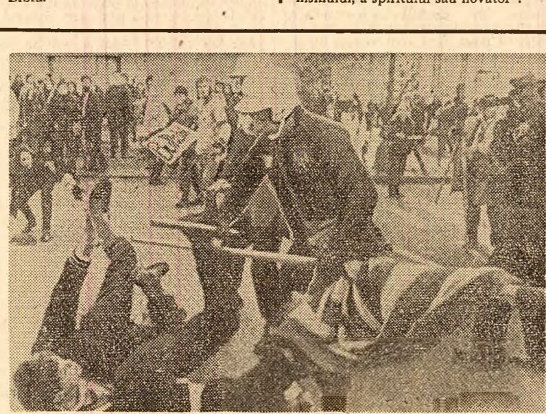
Politia din Washington imprăștiind un grup de manifestații care au protestat împotriva condamnarilor în procesul de la Chicago. După cum se știe, inculpații în acest proces fac parte dintr-o organizație pacifistă care cere încetarea războiului dus de S.U.A. în Vietnam

TRIPOLI 25 (Agerpres). — Președintele R.S.F. Iugoslavia, Iosip Broz Tito, a sosit miercuri la Tripoli, într-o vizită oficială de două zile în Libia.