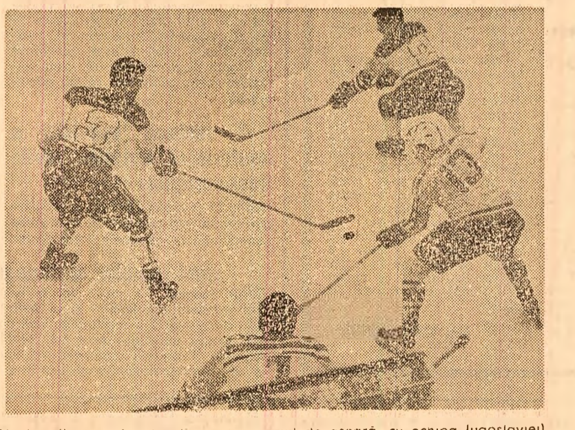
Hocheiștii noștri în atac (jazu an meciul de aseară, cu echipa Iugoslaviei)

CICLISM — După 4 etape, în turul ciclist al Sardiniei conduce bulgarianul Patrick Serou, urmat la 30 o de Franco Bivi, la 1 o de Van Vlietberghe. Eddy Merckx se află pe locul 7 la 1 o 54 o . Etapa a 4-a, Oristano—Alghero (166 km), a cîștigat-o Serou în 4h 37' 33".