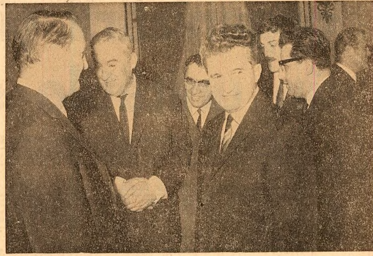
Tovarășul Nicolae Ceaușescu, secretar general al Partidului Comunist Român, prezintă la Consiliul de Stat al Republicii Socialiste România, a primit în după-amiaza zilei de 26 februarie a. c. la Palatul Republicii, pe membrii delegațiilor care participă la lucrările Confătuirii conducătorilor de uniuni de scriitori din țări socialiste ce se ține la București.