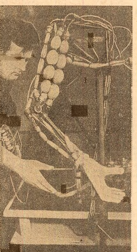
Un colectiv de oameni de știință de la Institutul politehnic și Academia de educație fizică din Varșovia a construit o proteză pusă în mișcare prin biocurenții care iau naștere în mușchii omului. Bioproteza efectuează 7 mișcări, permițînd decelerarea la bun sfîrșit a unor operațiuni complexe. Degetele artificiale pot apăca diferite obiecte, articulata bratului este capabilă să facă trei mișcări etc. Un nou pas spre crearea înlocuitorului perfect al membrilor superiori pierduți în urma unui accident