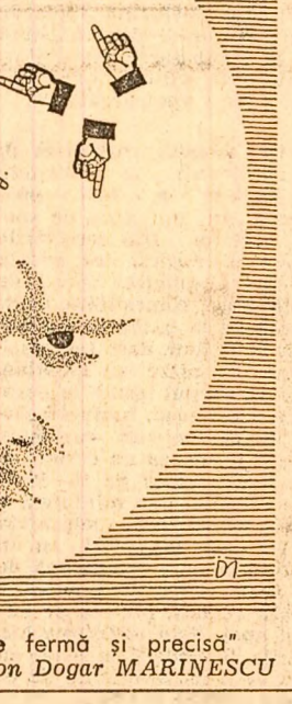
„Am luat o hotărîre fermă și precisă” Desen de Ion Dogar MARINESCU