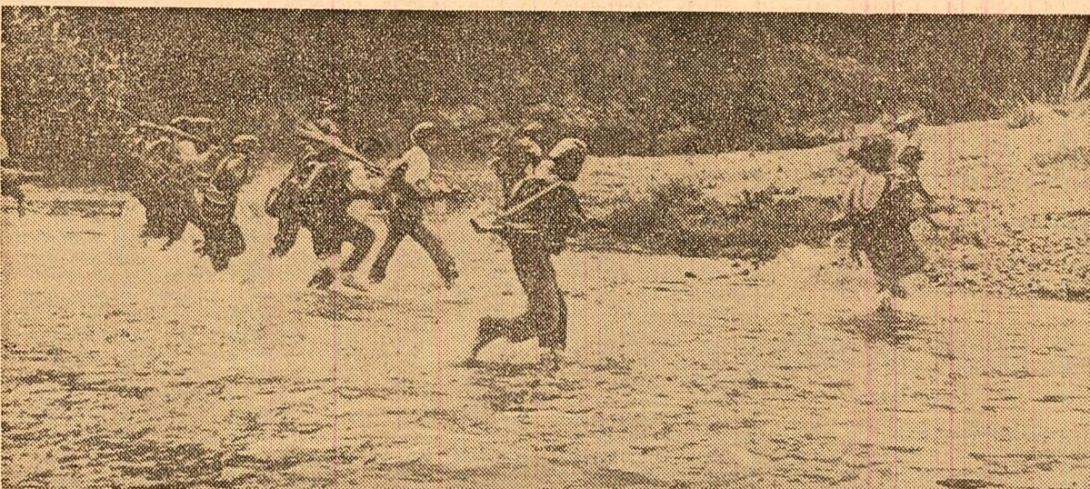
O unitate a forțelor patriotice laotiene, Pathet Lao, îndeplinind o misiune de luptă în Valea Ulcioarelor