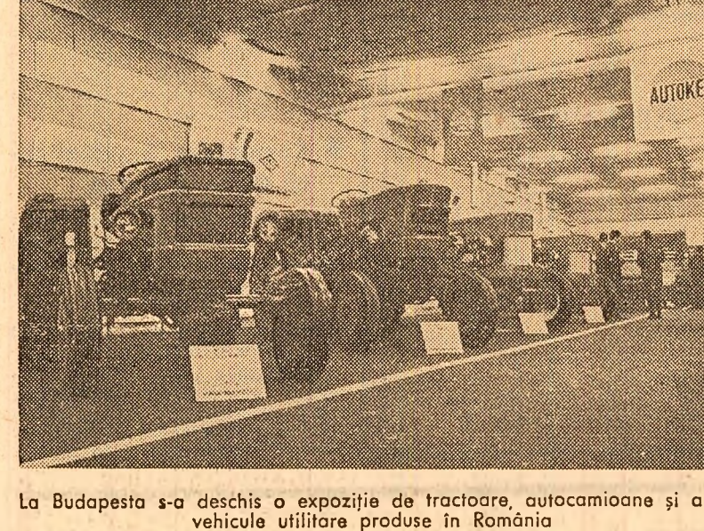
La Budapesta s-a deschis o expoziție de tractoare, autocamioane și alte vehicule utilitare produse în România

noastră victorie împotriva reacțiunii interne și externe”. El a menționat, de asemenea, că în urma luptelor care au avut loc luni dimineața, 30 de rebeli au fost uciși, iar din partea armatei congoleze au căzut doi militari. Postul de radio „Vocea revoluției congoleze” continuă să transmită numeroase mesaje de sprijin adresate guvernului și președintelui N'Gouabi. Informațiile transmise luni noaptea de agențiile de presă atestă că situația din Republica Populară Congo a revenit la normal, calmul domnind pretutindeni.