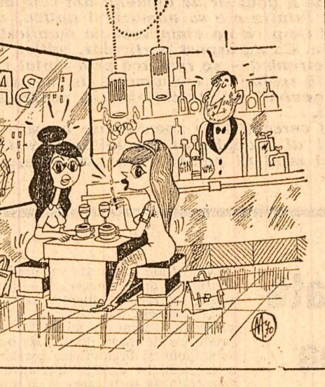
(Desen de Adrian ANDRONIC)