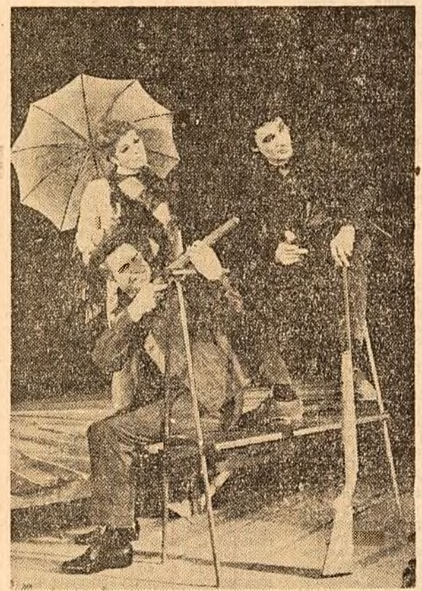
Scenă din spectacolul „Acești îngeri tristi” de D. R. Popescu, în interpretarea colectivului Teatrului „Mihai Eminescu” din Botoșani