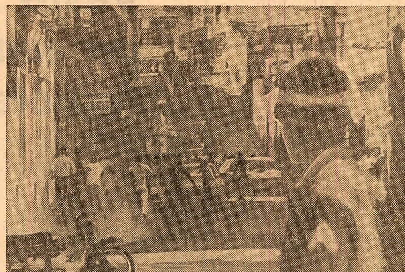
Infruntare între demonstrații și poliție la Santo Domingo

Referindu-se la diferitele apeluri cu privire la încetarea focului, președintele Nasser a declarat că, în momentul de față, nu se poate vorbi de întreruperea ostilităților, deoarece aceasta ar acordă Israelului timpul necesar pentru a-și consolida ocupația în teritoriile arabe aflate sub controlul său, și, totodată, posibilitatea de a evita consecințele unui război de uzură. În acest sens, președintele R.A.U. a subliniat că încetarea focului nu poate fi privită separat de aplicarea rezoluției Consiliului de Securitate al O.N.U., care prevede evacuarea teritoriilor ocupate.