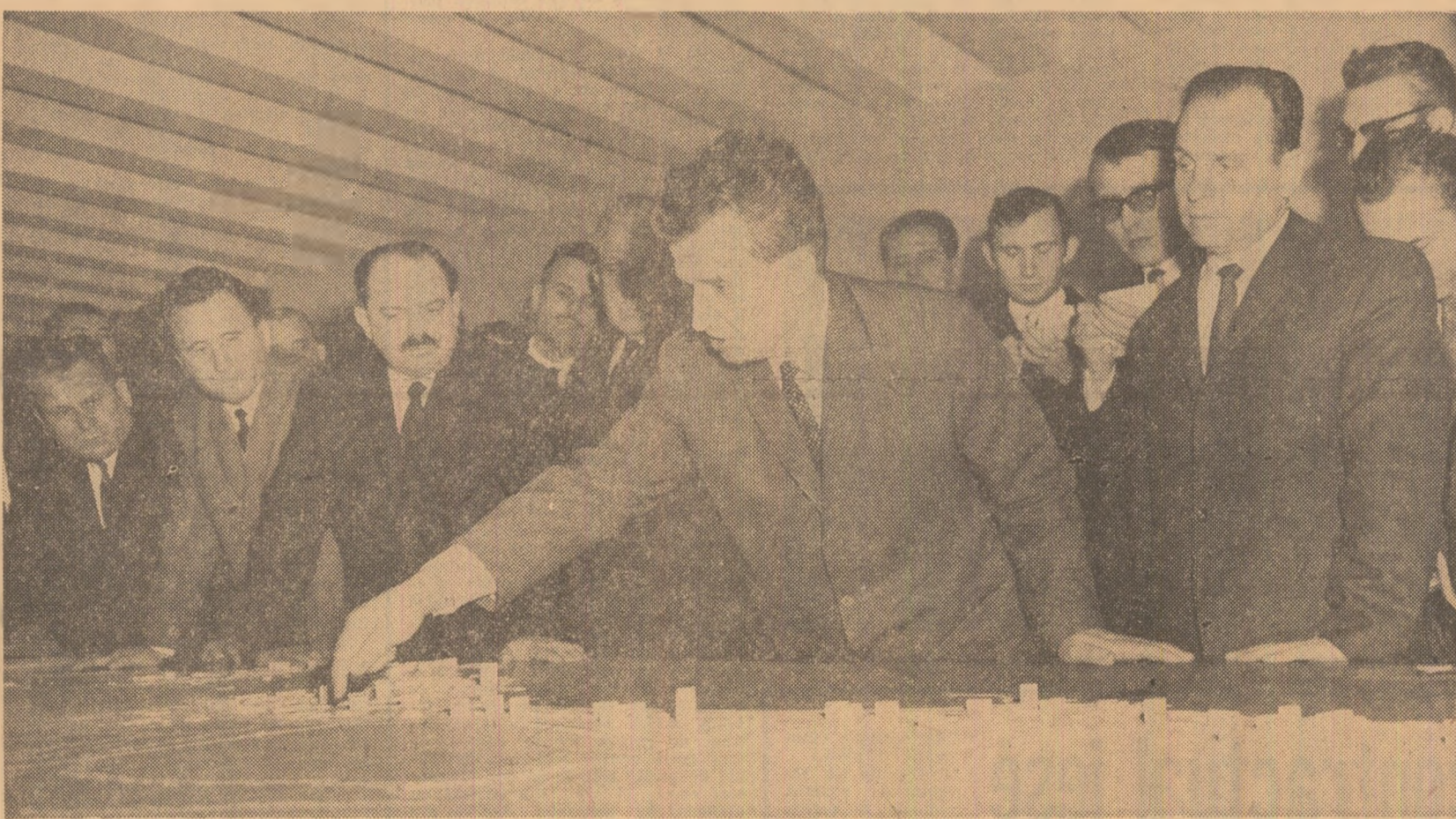
La Mangalia-Nord, oaspeților le-au fost prezentate machete înfățișând zonele turistice construite și propunerile pentru dezvoltarea lor în viitorul cincinal

Se conturează viitoarea constelație a litoralului românesc