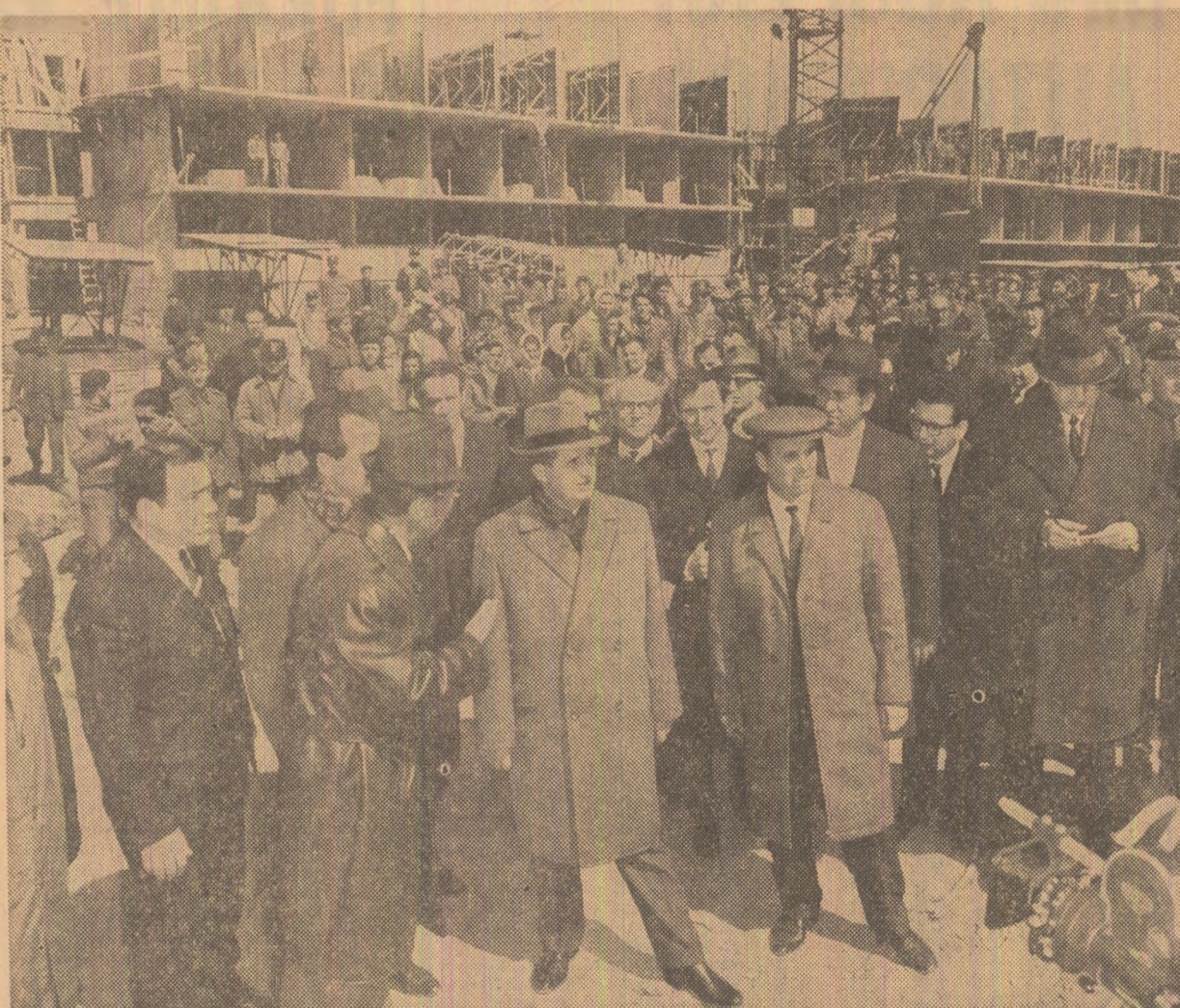
Pe unul din noile șantiere ale stațiunii Mangalia-Nord