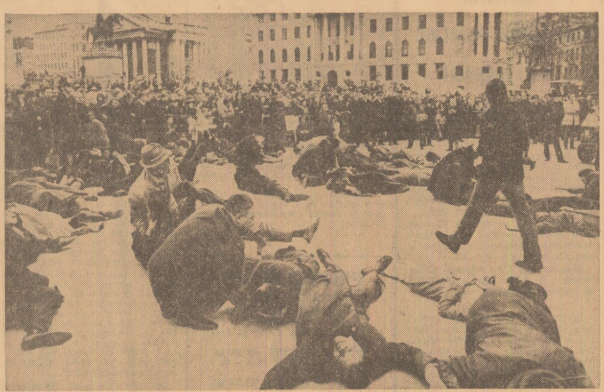
În Piața Trafalgar din Londra a avut loc o puternică demonstrație împotriva politicii de apartheid promovată de autoritățile Republicii Sud-Africane. Participanții la demonstrație au reprodus scene petrecute acum 10 ani în orașul sud-african Sharpeville, cînd cu prilejul unor manifestații ale populației poliția a deschis focul, ucigînd 69 de persoane

La actuala sesiune, comitetul va examina problema nerecuzării forțelor, a neintervenției în treburile interne și pe cea a dreptului popoarelor la autodeterminare. Participanții la sesiune vor elabora o Declarație a principiilor relațiilor dintre state, care urmează să fie prezentată celei de-a 25-a sesiuni a Adunării Generale a O.N.U.