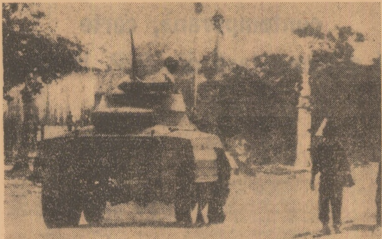
Cambodgia. Mașini blindate ale armatei patrulind pe străzile localității Kompong Cham, unde au avut loc ciocniri între trupele guvernementale și populația civilă care-l susține pe prințul Norodom Sihanouk

Miercuri seara, ministrul finanțelor, Cesar Charlone, și-a prezentat demisia în cadrul unui efort al președintelui urugvian, Pacheco Areco, de a întocmi o echipă ministerială care să permită obținerea sprijinului parlamentului.