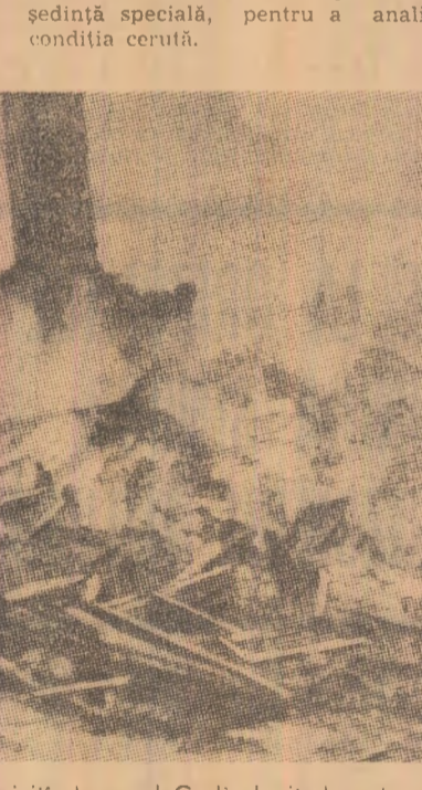
Turcia. Premierul Suleyman Demirel vizitînd orașul Gediz lovit de cutremur

ANKARA 2 (Agerpres). — În Anatoalia apuseană, regiune a Turciei aflat de mult înconștinată în ultimele zile de numeroasele cutremure de pământ, comunitățile și asociațiile de salutare a supraviețuitorilor, de apărare a populației sinistrate împotriva foametei, frigului și epidemiilor. Echipole de salvare caută sub dărâmurii alți posibili supraviețuitori ai cata-