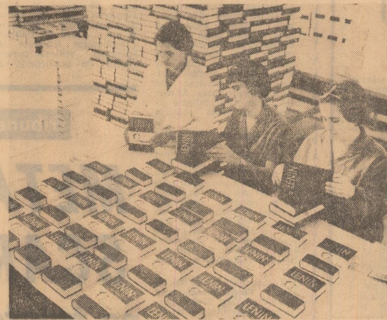
EDITURA „MIHAI EMINESCU”

lor clasice ale marxism-leninismului. O expresie elocventă a amplitudinii pe care a căpătat-o publicarea lucrărilor lui V. I. Lenin o constituie faptul că de la 23 August 1944 Editura politică a tipărit peste 170 de titluri într-un tiraj de circa 6 500 000 de exemplare. Au văzut, totodată, lumina tiparului — în limba română și în limbile naționalelor conlocuitoare — numeroase culegeri tematice, documente, amintiri, studii etc. despre viața și activitatea revoluționară a marelui Lenin, în sute de mii de exemplare. În acest an — anul sărbătoririi unui veac de la nașterea lui Lenin — are loc, din inițiativa și prin grija Partidului Comunist Român, o intensificare a întregii activități editoriale având ca obiect viața și opera marelui conducător revoluționar. În toate editurile se află în prezent sub tipar numeroase cărți — de la volume de opere ale lui Lenin și până la studii, evocări, amintiri, lucrări literare, poezii etc. În pagina de față înfățișăm ctititorii noștri conținutul unora dintre acestea.