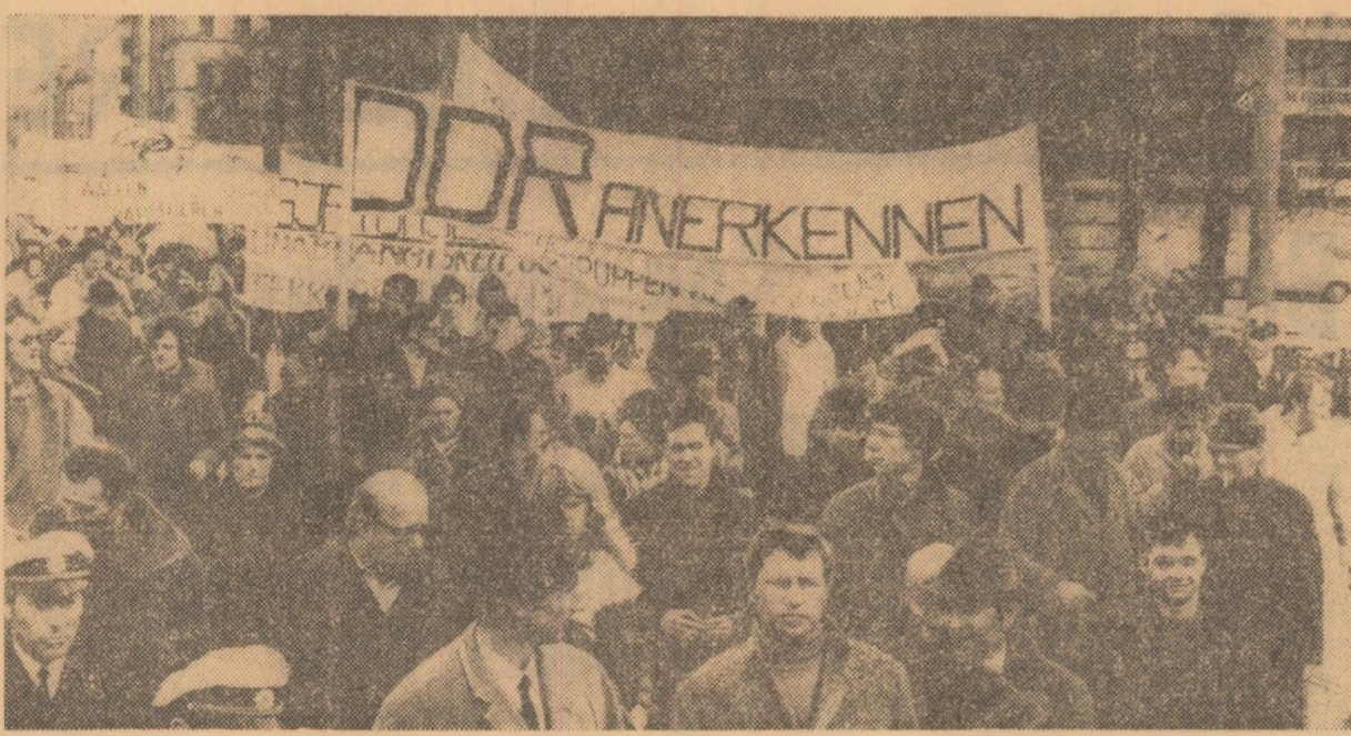
München (Republica Federală a Germaniei). Participanții la acest marș pentru pace militează pentru destindere, dezarmare, normalizarea relațiilor dintre cele două state germane și participarea lor la lupta pentru securitate în Europa și în lume. Pe una din pancarte se poate citi: „Să fie recunoscut R.D.G.”

MOSCOVA 3. — Corespondentul Agerpres, L. Duță, transmite: „Printr-o partenerie comercială al Uniunii Sovietice se află peste 100 de state ale lumii, iar cu 82 de state Uniunea Sovietică face comerț pe bază de acorduri interguvernamentale”, a declarat M. R. Kuzmin, prim-locșer al ministrului comerțului exterior, la o conferință de presă. Vorbitorul a arătat că ponderea țărilor socialiste în comerțul exterior sovietic este de 23% ajunșind în anul 1959 la 12.900.000.000 ruble. A cunoscut, de asemenea, o creștere considerabilă circuitul comercial al U.R.S.S. cu țările în curs de dezvoltare: de la 1.400.000.000 ruble în 1965 la 2.500.000.000 ruble în 1969. Volumul comerțului U.R.S.S. cu țările capitaliste a crescut în perioada 1965-1969 de la 2.815.000.000 la 4.331.000.000 ruble. Cu Franța, comerțul a crescut în perioada menționată de la 202.400.000 ruble la 417.400.000. Noul acord comercial pe termen lung, a spus vorbitorul, prevede o nouă creștere considerabilă a comerțului sovieto-francez pe perioada 1970-1974. Comerțul sovieto-italian a crescut în perioada 1965-1969 de peste două ori, adică de la 224.700.000 la 493.500.000 ruble. La aceasta a contribuit într-o mare măsură contractul cu firma italiană „FIAT”, de colaborare în construirea uzinei de automobile. Încheierea cu succes a tra-