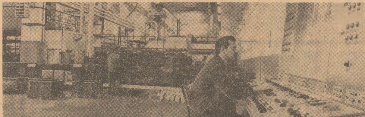
În sectorul de tratamente termice al uzinei „1 Mai”-Ploiești