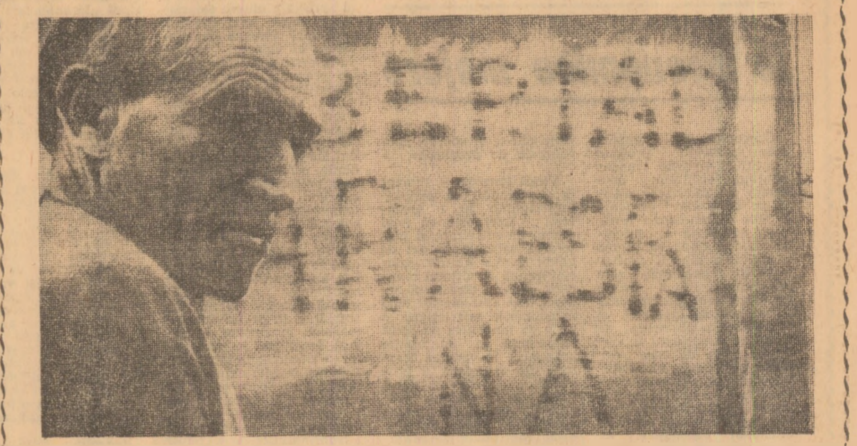
„Libertate para Espana“ („Libertate pentru Spania“). Autorităţile acoperă cu var astfel de lozinci înscrise de mineri la intrările în exploaţi, dar ele continuă să apară mereu în alte locuri

„Libertate para Espana“ („Libertate pentru Spania“). Autorităţile acoperă cu var astfel de lozinci înscrise de mineri la intrările în exploaţi, dar ele continuă să apară mereu în alte locuri. Nici arcade din zid, nici case în stil maur, nici mormoni de vînt strălucind de un alb imaculat, nici stăpîni de reflexe maronii, nici lanuri nesfîrşite de grâu, nimic din idila zugrăvită de unele reviste atunci cînd înfăşează Spania. Şi, totuşi, aceste lucruri — cele mai puternice din 1962. Centrul lor se afla în Asturia. Minerii de aici au cea mai veche tradiţie şi cea mai bogată experienţă de luptă din ţară.