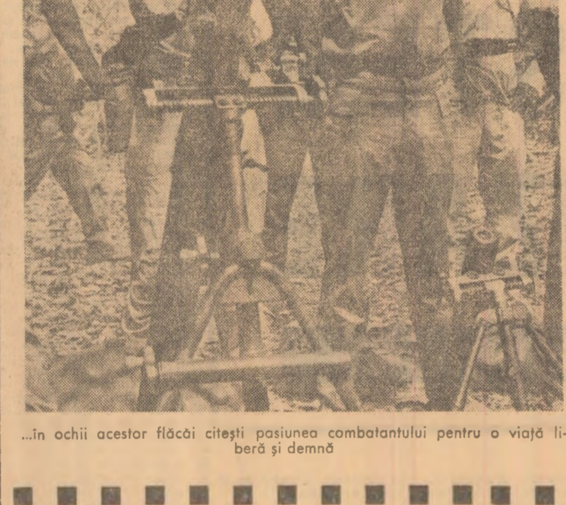
...în ochii acestor flăcăi citeşti pasiunea combatanţilor pentru o viaţă liberă şi demnă

Casa are o vechime de 100 de ani. Pe acoră nu există lumină. Treptele scării în faţa porţii sînt pline de apă. Într-o cameră, un bărbat stă pe o bancă, privind în gol. În faţa lui, un bărbat stă pe o bancă, privind în gol. În faţa lui, un bărbat stă pe o bancă, privind în gol.