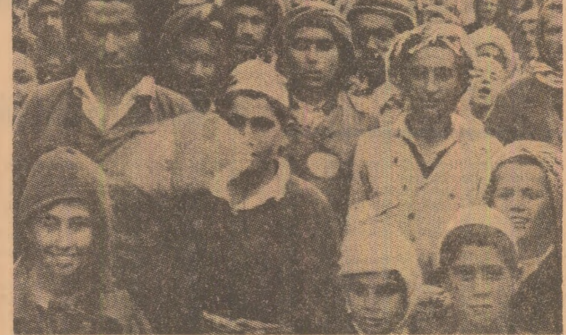
Irak: Populația kurdă din Kirkuk, manifestîndu-și sprijinul față de măsurile care au dus la restabilirea păcii în țară

Locul astronautului Mattingly va fi luat de John Swigert.