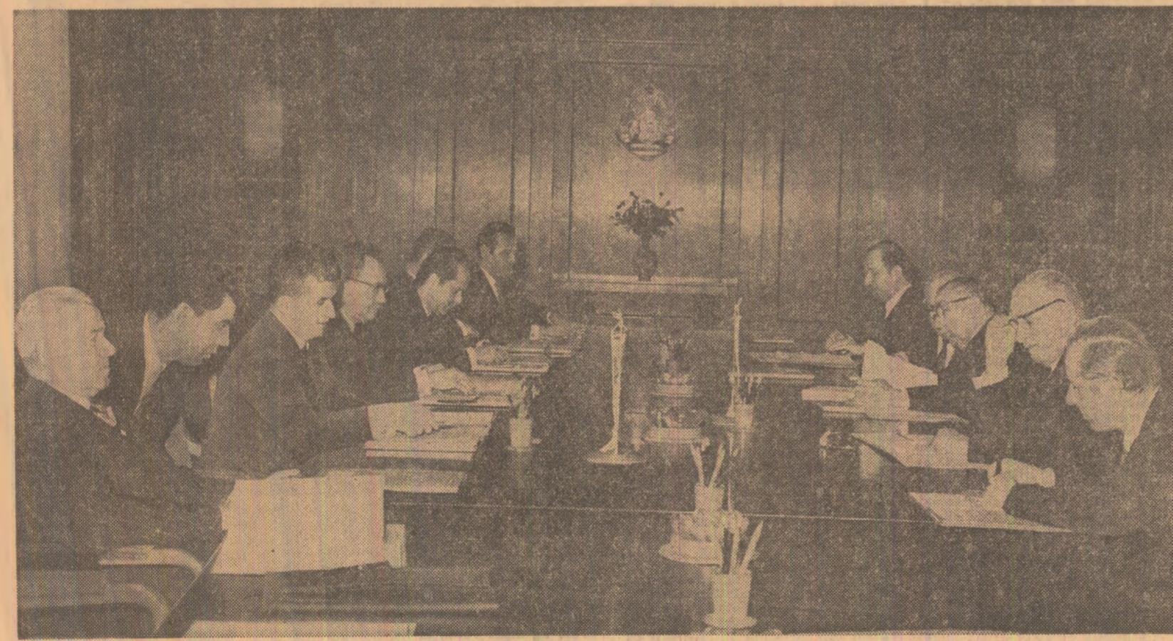
În timpul convorbirilor oficiale

Recepția s-a desfășurat într-o atmosferă cordială, prietenească. (Agerpres)