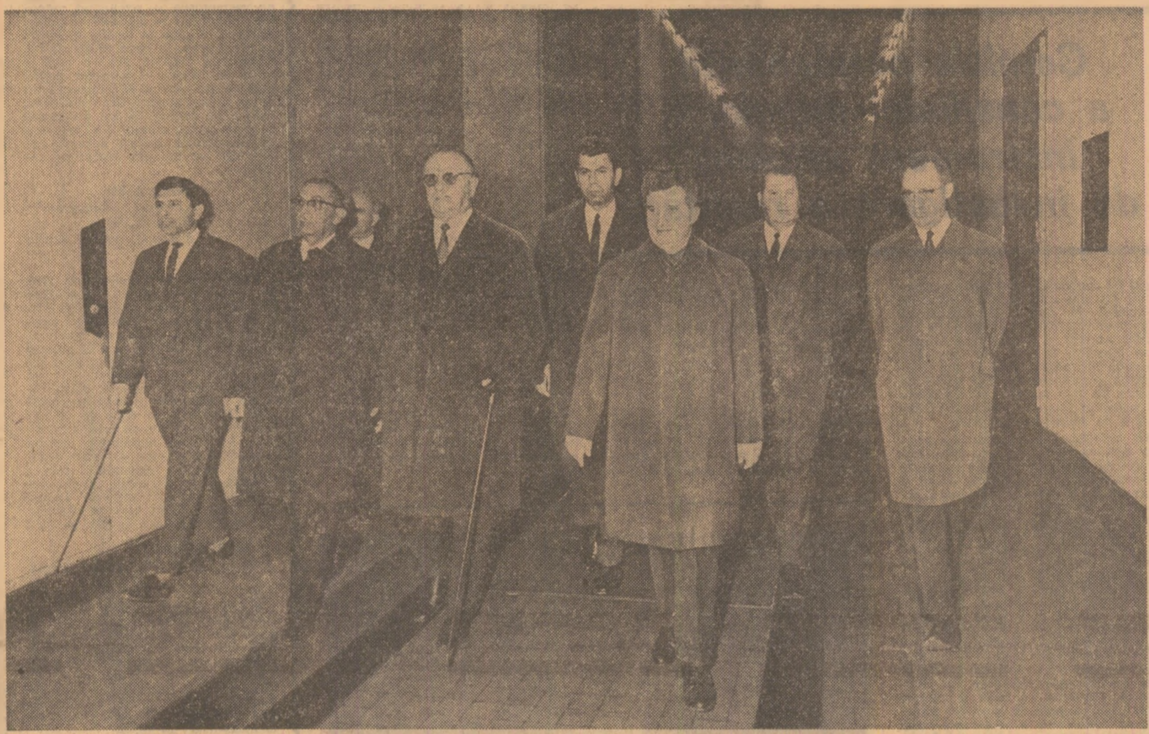
Se vizitează centrala subterană, locul unde torentul de apă se transformă în lumină