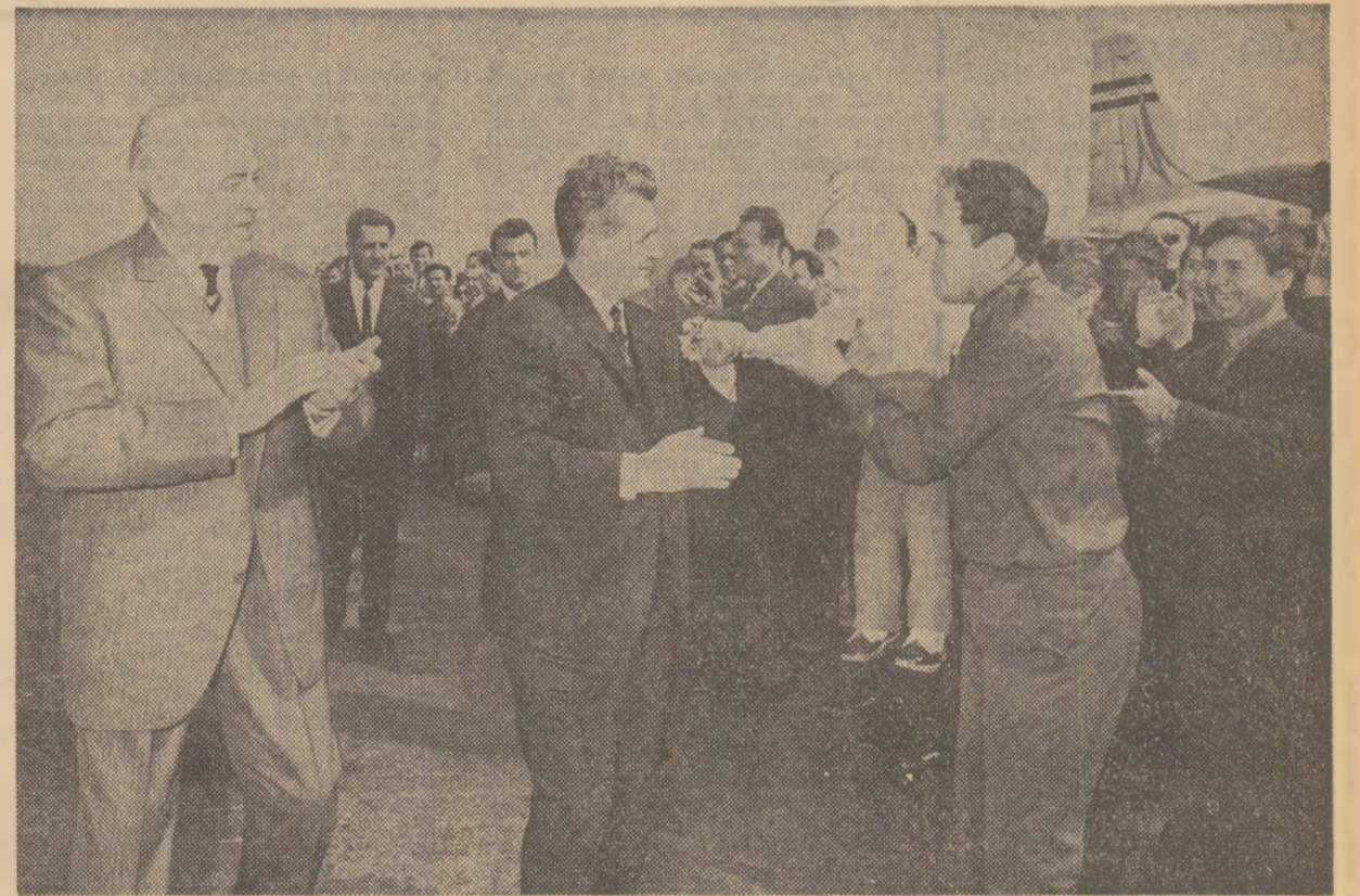
La sosire, pe aeroportul Băneasa