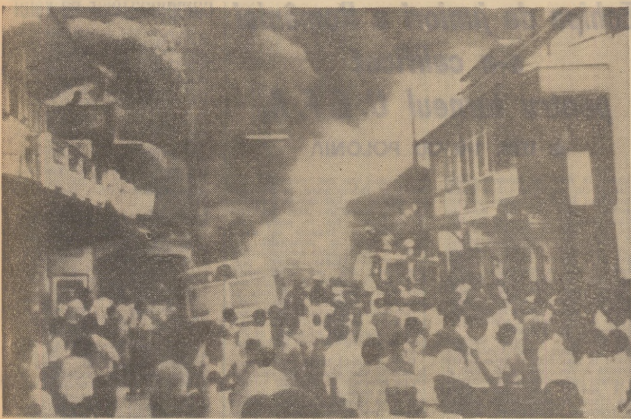
EVOLUȚIA INCIDENTELOR DIN TRINIDAD-TOBAGO

PORT OF SPAIN 23 (Agerpres). — La Port of Spain s-a anunțat că un grup rebel a început tratative cu procurorul general al Republicii Trinidad-Tobago în vederea încetării războiului militarilor de la baza Chaguaramas. Situația de la această bază, aflată la 17 km nord de Port of Spain, continuă să rămână neclară. Forțele armate prind că dețin controlul asupra bazei și că unii rebeli, care cer drepturi mai mari pentru populația neagră din insulă, ar fi fugit în pădurile apropiate pentru a duce lupte de guerilă, dar alte surse afirmă că răsculații continuă să stăpânească baza.