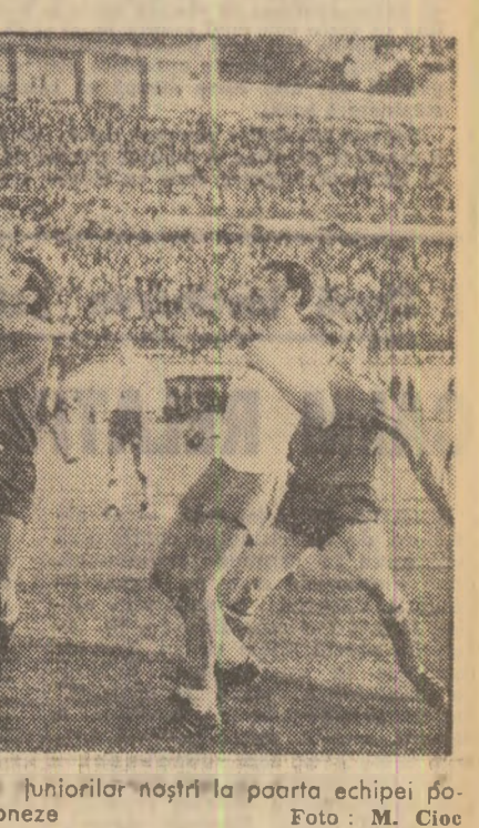
Unul din numeroasele atacuri ale juniorilor noștri la poarta echipei poloneze.