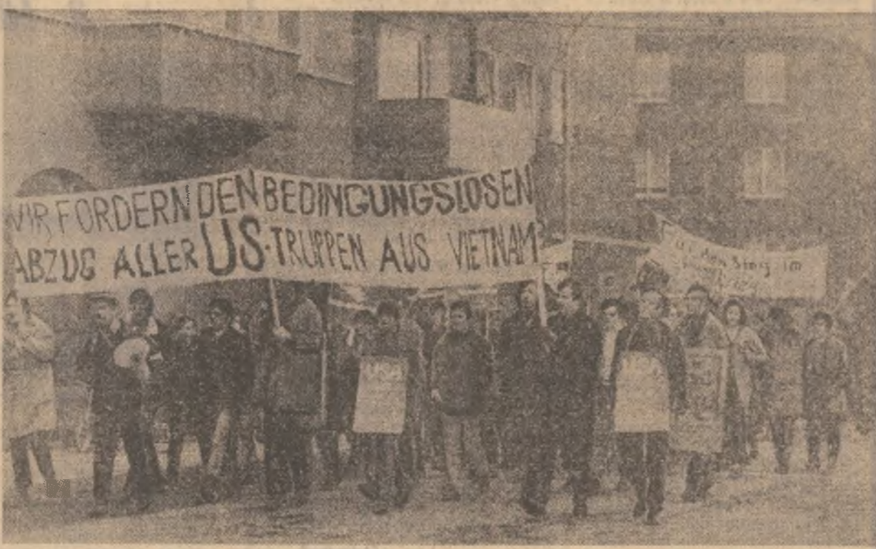
O mare demonstrație la Essen (R. F. a Germaniei), împotriva războiului dus de S.U.A. în Vietnam

Obținându-și independența în 1804, Haiti este una dintre primele republici negre din lume. Ea are o suprafață de 27.750 km 2 și o populație de 5 milioane locuitori. Potrivit statisticilor, 80 la sută din locuitorii țării sînt analfabeți.