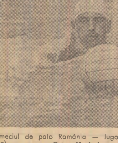
Luptă dirză pentru balon (Fază din meciul de polo România - Iugoslavia)

Maestrul sportului C. GRINTESCU, despre meciul de polo pe apă România-Iugoslavia, disputat în piscina „Dinamo“ din Capitală: „Selecționatul iugoslaviei - campion mondial - este la ora actuală una dintre cele mai puternice formații de polo din lume. După 25 de succese în fața poloiștilor iugoslavi, iată-ne în fine, victorioși! Chiar dacă este vorba de acei 6-5, de simăbă, victorie la limită, nu greșesc afirmând că poloiștii români au făcut de această dată una dintre cele mai bune partide internaționale, fiind mult superiori adversarilor lor. O singură dată, la început, au condus iugoslavii, apoi avantajul s-a fost permanent de par-