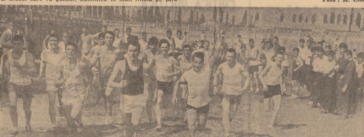
Fotografia noastră este o imagine de la întrecerea tinerilor din sectorul I din Capitală.

Correspondenții din 19 județe ne-au transmis, ieri după-amiază, zinduri frumoase despre entuziasmele întrecerii atletice participanți la țaza județeană a „Crosului tineretului“, care a avut loc în numeroase localități. La Constanța, cel peste 600 de tineri și tinere au transformat poleiul din marginea localității Mihail Kogălniceanu într-o veritabilă bază sportivă. La Timișoara, orașul care va găzdui, duminică 10 mai, finala pe țară a competiției, s-au prezentat la startul disputei peste 500 de tineri, iar la Bacău, în parcul din cartierul Corniș Bistriței, numărul atleților a fost aproximativ același. Ca și în celelalte județe - Argeș, Bihor, Bistrița-Năsăud, Tulcea, Vrancea etc.