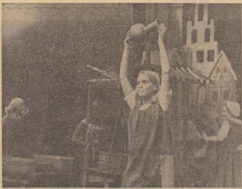
Scenă din „Regele Drosselbart” în interpretarea Teatrului „Freundschaft” din Berlin