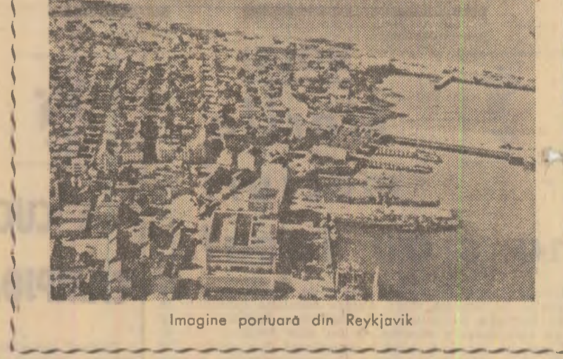
Imagine portuară din Reykjavik

Sint planuri și pentru o mai amplă utilizare a apelor termale care împing subsoiul fierbinte al insulei. Într-o scurtă călătorie până la Reykjavik, la 18 km de capitală, am existat stația de captare și pompare a apei termale subterane, pe care conducătorul o trimite să încălzească șerele și locuștii din Reykjavik. Temperatura unor gheizere trece de 80 de grade Celsius, în timp ce dintr-un puț forat în apropiere, la 2 200 metri adâncime, vine apă dătoată, la 15 grade Celsius. Inginerii islandezi întrebă posibilitatea de a transforma giganticele resurse termale ale insulei în energie electrică ieftină, pentru industrie. La aceste latitudini nordice, un popor mic dar harnic și întreprinzător își arată hotărârea de a câștiga bătălia cu natura sterilă.