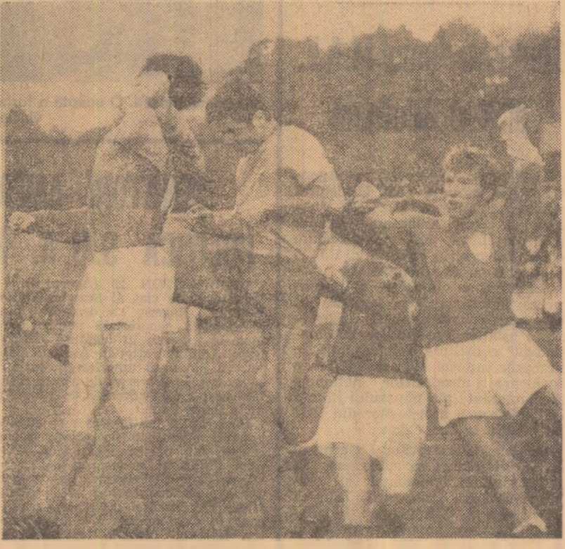
Trei apărători francezi, un singur atacant român. (Fază din meciul România — Franța — echipele de tineret)