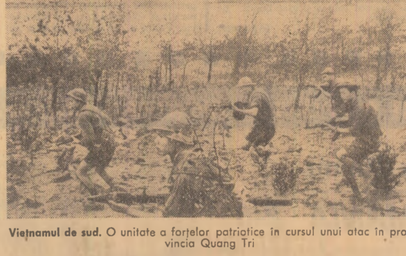
Vietnamul de sud. O unitate a forțelor patriotice în cursul unui atac în provincia Quang Tri.

S-a stabilit ca următoarea întîlnire să aibă loc la 14 mai.