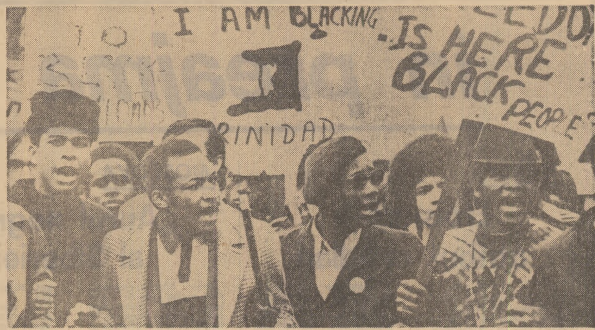
Cetățeni britanici, originari din Antile, demonstrând la Londra împotriva amestecului străin în Trinidad-Tobago

BOGOTA 29 (Agerpres). — Guvernul columbian a ridicat unele dintre restricțiile impuse săptămîna trecută prin decretarea stării de urgență, după tulburările ce au urmat publicării rezultatelor scrutinului prezidențial, câștigat de candidatul guvernamental, Misael Pastrana Borrero. Intrucît candidatul partidului „Alianța națională populară”, Rojas Pinilla, a contestat rezultatele alegerilor, guvernul a dispus, după cum se știe, renunțarea voturilor. Dar, cu toate că după renunțarea a aproximativ 90 la sută din totalul voturilor rezultatele dau din nou câștig de cauză candidatului guvernamental, Rojas Pinilla continuă să afirme că s-au comis fraude, declarându-se învingător în aceste alegeri. Declarațiile sale întrețin o atmosferă de tensiune în țară.