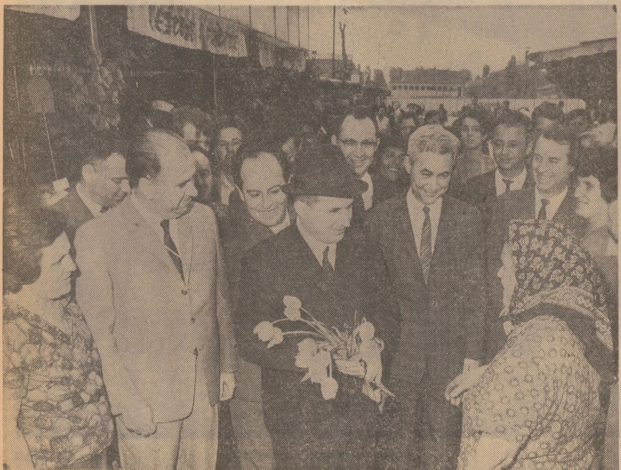
În piața Pantelimon, ca și în celelalte piețe ale Capitalei, s-a legat un dialog viu între conducătorii de partid și de stat și cetățeni pe probleme legate de aprovizionarea cu produse agroalimentare