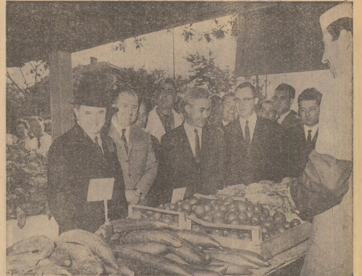
În piața Dorobanți din Capitală

În același timp, clasa muncitoare din România s-a bucurat permanent de simpatia și solidaritatea proletariatului, a detașamentelor mișcării revoluționare a comunistilor, a militanților socialiști, a oamenilor democrați și progresiști din diferite țări ale lumii — simpatie și solidaritate care au constituit izvor de forță și încrețire în victorie. În perioada de peste un sfert de veac ce s-a scurs de la eliberarea țării și înfăptuirea revoluției populare, Partidul Comunist Român, conducînd opera de edificare a socialismului în patria noastră, a ținut sus, statornic și neabătut, stindardul internaționalismului proletar, a acționat și acționează cu consecvență ca detașament activ al mișcării comuniste, muncitorești și revoluționare internaționale, al frontului mondial antiimperialist, sprijinind în permanență lupta oamenilor muncii, a popoarelor de pe toate continentele pentru cauza libertății, progresului și păcii în lume. Călînzîndu-se de cerințele majore ale internaționalismului proletar în condițiile de astăzi, cînd socialismul a învins în 14 state, partidul nostru situează statornic în centrul politicii externe a României prietenia și alianța frățească cu toate țările socialiste — de care ne simțim legați prin comunitatea de orînduire, de ideolo-