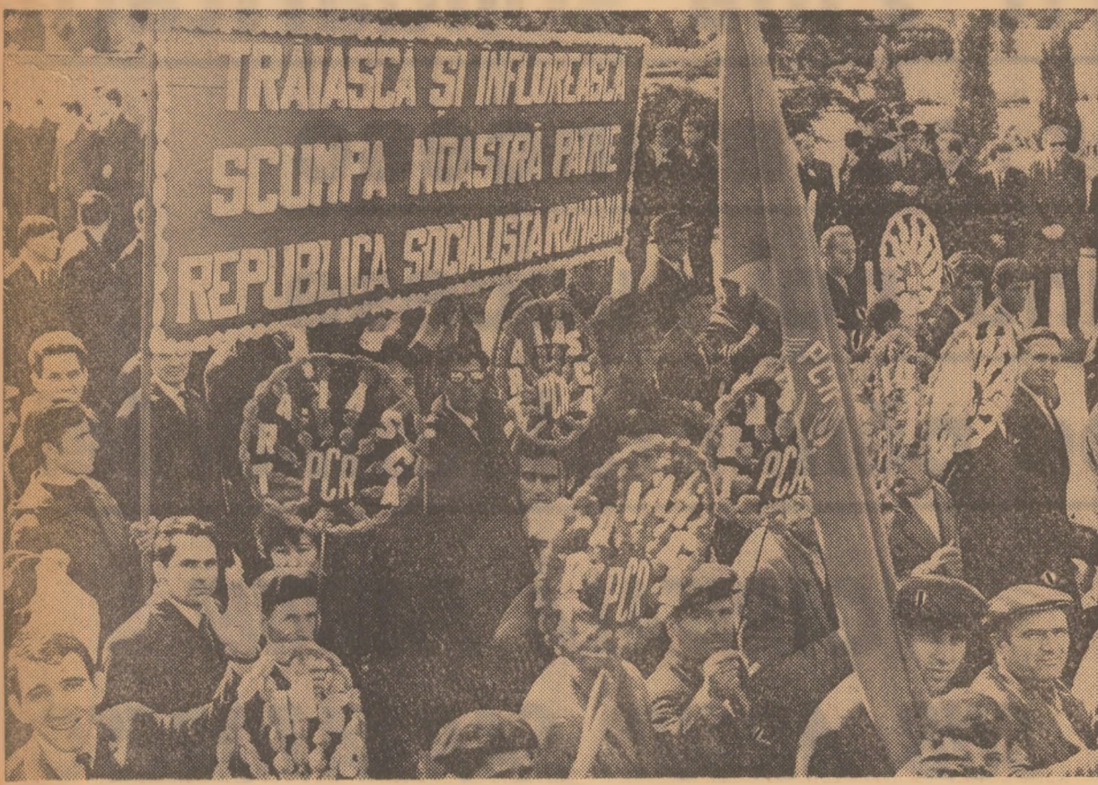
Mindri de prefacerile înnoitoare petrecute pe meleagurile județului lor, oamenii muncii din Craiova au manifestat pentru rodnicia muncii, pentru pace, pentru bunăstare