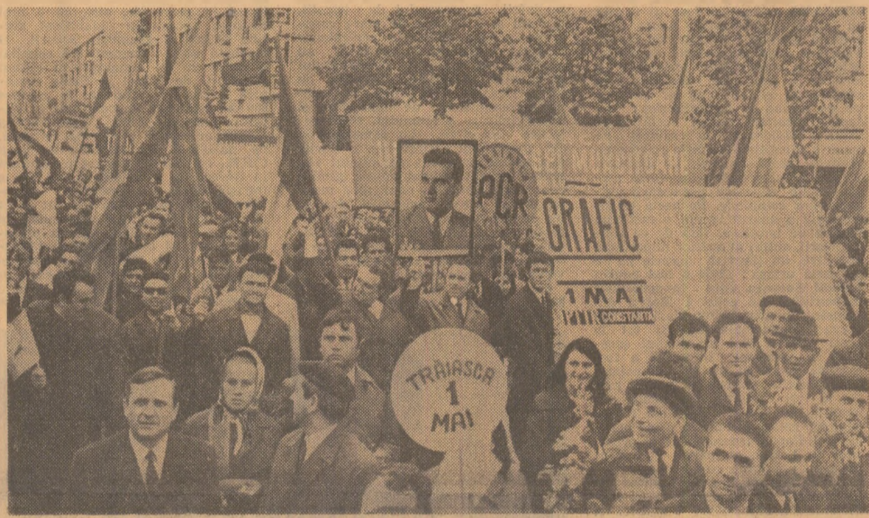
Imagini de la demonstrația oamenilor muncii din Constanța. Ei și-au exprimat hotărîrea fermă de a îndeplini prevederile Congresului al X-lea al partidului, de a realiza și depăși sarcinile de producție, de a munci cu tot elanul pentru continua înflorire a patriei socialiste