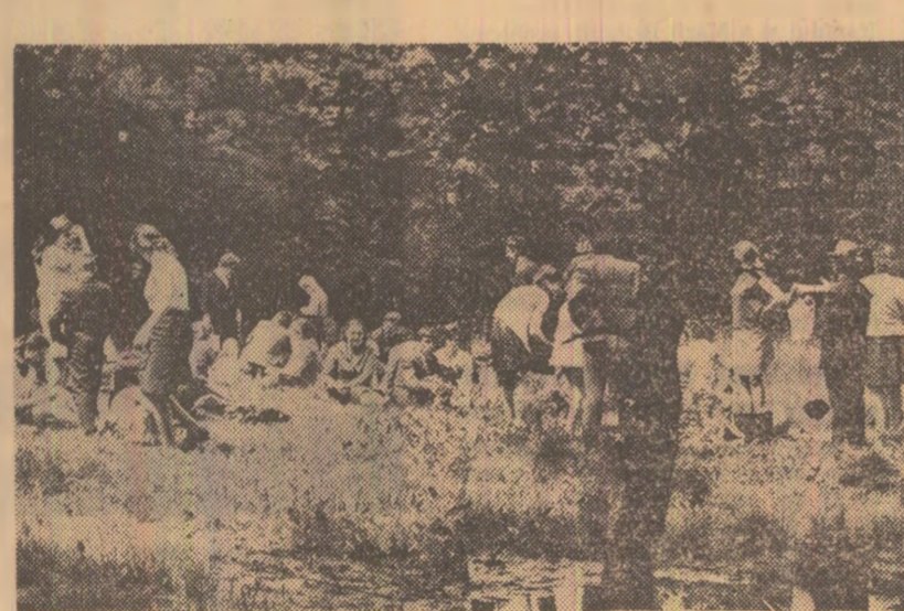
...și la Băneasa

Nici acest început de mai n-a dezmințit tradiția bucurărilor de a-și petrece zilele de sărbătoare în parcul Cișmigiu, Herăstrău, Teiul, Parcul Libertății, Băneasa și alte puncte din podoba de verde din oraș. Într-o zi de mai, un grup de vizitatori soșiți din țară. Dintre-o dată, parcurile și pădurile s-au umplut cu binevoitori voioși; tranzițiile, magnetofonele și... toată gama de instrumente muzicale erau nelipite de la „mesele” și jocurile întinse pe pașii. În aceste zile, ambarcațiunile de pe salba de lacuri a Bucureștiiului au dat „examen” pentru sezonul cald. La debarcarea lacului Herăstrău sau în jurul lacului, în plin centrul unuia dintre cele mai mari cartiere bucureștene construite în anii din urmă — Balta Albă — erau prezenți zeci și sute de amatori de plimbări de agrement. Momentele de destinație petrecute ieri au constituit o veritabilă cură tonifiantă pentru toți cei ce... nu au stat acasă.