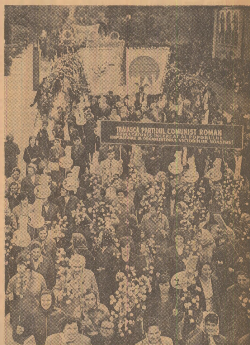
Flori și vioioșie în orașul de pe malurile Begli

1 Mai 1970 a marcat, totodată, voința fermă, de neclintit, a fililor patriei — români, maghiari, germani și de alte naționalități — de a nu-și precupeți eforturile în marea operă de edificare a socialismului în țara noastră. Manifestând pentru prietenia și colaborarea frățească dintre poporul român și popoarele tuturor țărilor socialiste, pentru unitatea clasei muncitoare din lumea întreagă în lupta pentru pace, democrație și socialism, pentru unitatea tuturor forțelor care luptă împotriva imperialismului, oamenii muncii au dat o înaltă apreciere politicii interne și externe a partidului și statului nostru, a conducerii sale. Au răsunat puternic izvoarele din inimă urale pentru Partidul Comunist Român, pentru Comitetul său Central. Miș de glasuri scandau „Ceaușescu, Ceaușescu“, nume scump întregii națiuni, care simbolizează dirigența, voința de muncă a întregului nostru popor, certitudinea curei însuflețite muncă de azi, îndreptată spre zărilor clare ale zilei de mâine, spre perspectivele de dezvoltare deschise de Congresul al X-lea al Partidului Comunist Român.