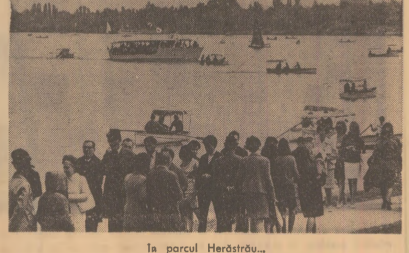
la parcul Herăstrău...