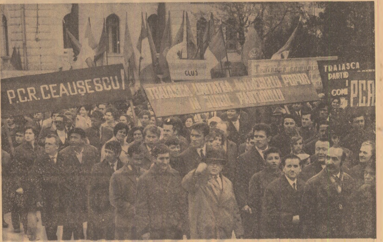
Într-o revărsare entuziastă de urale, avajii, oamenii muncii din Cluj își manifestă adevărată deplină la politica internă și externă a partidului și statului nostru

Patre NEDELICU cu sprijinul corespondenților „Scintei”