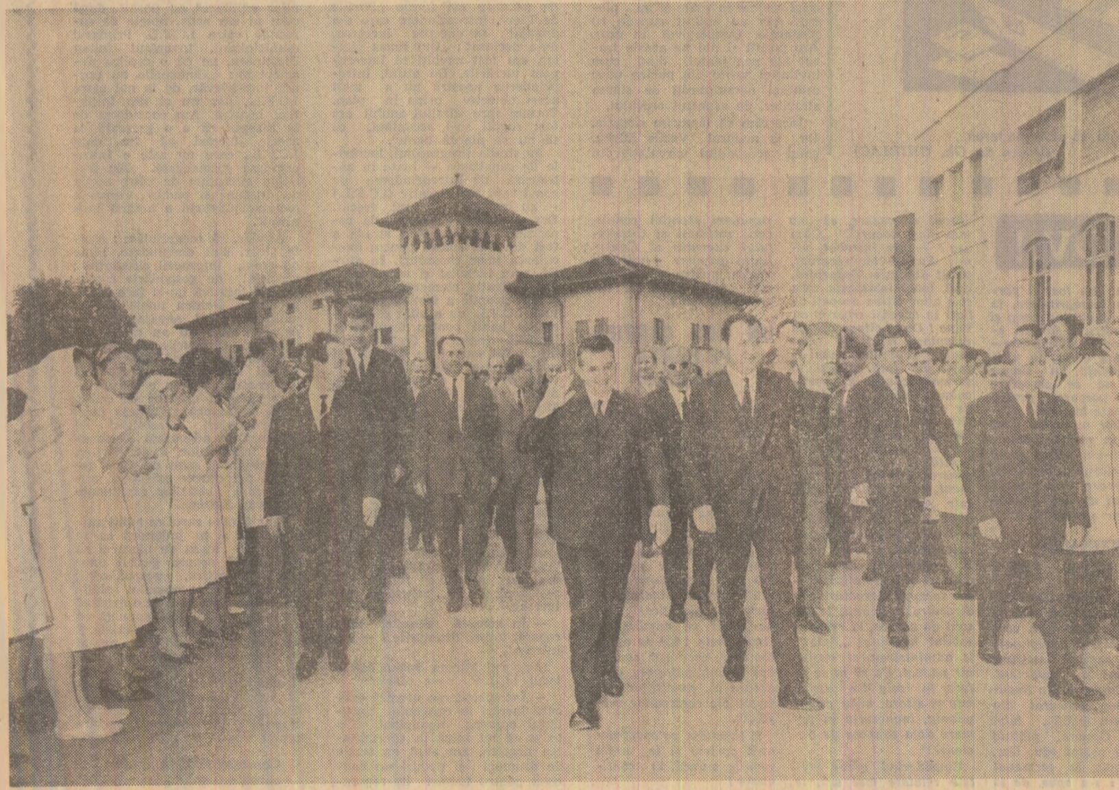
În incinta institutului, conducătorii de partid și de stat sînt întâmpinați cu deosebită căldură și entuziasm

Spectacolul a fost transmis în direct de studioul nostru de televiziune. (Agerpres)