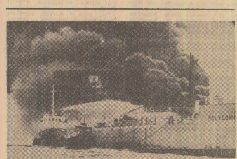
Un incendiu violent a izbucnit marți la bordul unui tanc petrolier norvegian de 28.000 tone, care transporta petrol brut. Accidentul, ale cărui cauze nu se cunosc încă, a survenit în momentul cînd vasul părăsea portul spaniol Vigo, îndreptîndu-se spre Donges (Franța)

războiului și a încheia tratate” și că acest lucru nu poate fi îngăduit. Posturile de radio și televiziune, cit și presa americană, subliniază că întrevedere de marți a președintelui Nixon cu membrul comitetelor pentru serviciile armate și pentru relații externe ale Senatului și Camerei reprezentanților nu a adus nici un element nou capabil să determine schimbarea într-un fel sau altul a pozițiilor congresmenilor față de invazie. „Cei care erau operațiunea să fie prelungită peste data stabilită, declarînd că, în acest caz, va cere aprobarea Congresului. Angajamentul, încă destul de imprecis, al președintelui de a retrage trupele americane din Cambodgia, menit după părerea unor senatori să slăbească presiunile Congresului asupra Administrației, nu s-a soldat cu rezultatele scontate, ea nu a redus dimensiunile opoziției și îngrijorării față de această nouă extindere a conflictului din Asia de sud-est. Gruparea liberalilor și mo-