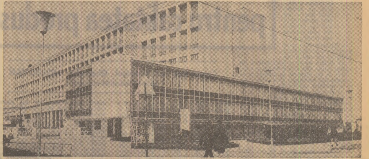
Un pilon al dezvoltării industriale a județului Vrancea: Fabrica de confectionerie din Focșani

Alexandru MUREȘAN corespondentul „Scînteii”