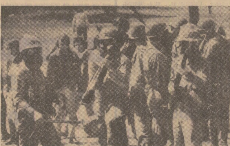
La Universitatea din Kent, Ohio, au avut loc puternice demonstrații împotriva războiului din Vietnam și intervenția în Cambodgia. În fotografie intervină membrii Gărzii naționale împotriva demonstrațiilor. Pe caldărim una din cele patru persoane ucise în cursul incidentelor

Noua lege prevede, printre altele, ca societățile comerciale, inclusiv cele de import-export, să dispună numai de capital libian. De asemenea, orice societate pe acțiuni va trebui să aibă cel puțin 51 la sută capital libian, iar majoritatea consilierilor de administrație să fie alcătuită din cetățeni libieni.