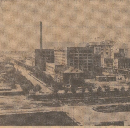
În fotografie: Aspect exterior al uzinei.

de regulă, pe baza normelor tehnice de muncă și a prețurilor unitare; în cazul lucrărilor ce se execută în condiții similare, sumele pot fi determinate și pe bază de norme tehnice de muncă — stabilite global și unificate pe șantier, grup de șantier sau pe întreprindere, iar pentru lucrările ce se execută în condiții diferite (locuințe, clădiri social-culturale etc.), pe baza prețurilor pentru manopera prevăzută în cataloagele de prețuri unificate de articole de deviz, la care se adăugă prețurile lucrărilor de servicii. Pentru a da posibilitate conducătorului șantierului să aprecieze eforturile și timpul efectiv lucrat, în vederea executării unor lucrări urgente sau în condiții diferite de cele la care se desfășoară activitatea obișnuită, acesta are dreptul să modifice cu până la plus sau minus 15 la sută prețurile unitare din unele capitole de normă pentru anumite cantități (meserii etc.), precum și sumele stabilite în norma globală unificată, pentru anumite lucrări (meserii), cu condiția de a se încadra în costurile planificate pe întreaga lucrare. Sumele stabilite sunt ferme și se plătesc integral formației de lucru indiferent de timpul lucrat, la terminarea lucrării, dacă aceasta respectă termenul de predare și asigură calitatea corespunzătoare a lucrării. Această prevedere dă posibilitatea sporirii câștigurilor individuale ale membrilor formației de lucru, dacă aceasta își organizează bine munca, recuperează pe parcurs eventualele întârzieri, fo-