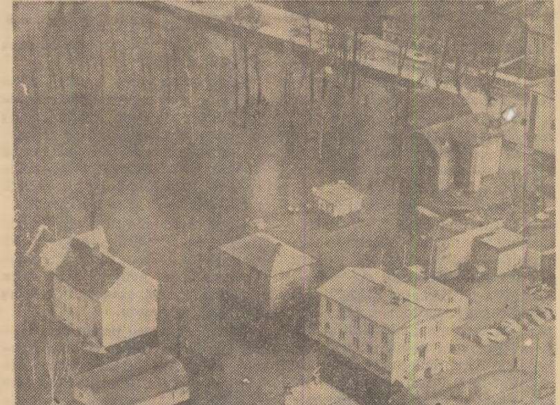
Topirea zăpezii a provocat mari inundații în regiunile sudice ale Suediei. În imagine: case izolate de apele revărsate în localitatea Värmsån.

Situația din Columbia continuă să rămîna încărcată, a declarat președintele țării, Carlos Lleras Restrepo, la o conferință de presă radio-televizată. El a spus că susținătorii fostului președinte Rojas Pinilla, care a candidat la alegerea prezidențială din 19 aprilie și a fost înfrînt, continuă să provoace dezordini atât în capitală cît și în orașele de provincie.