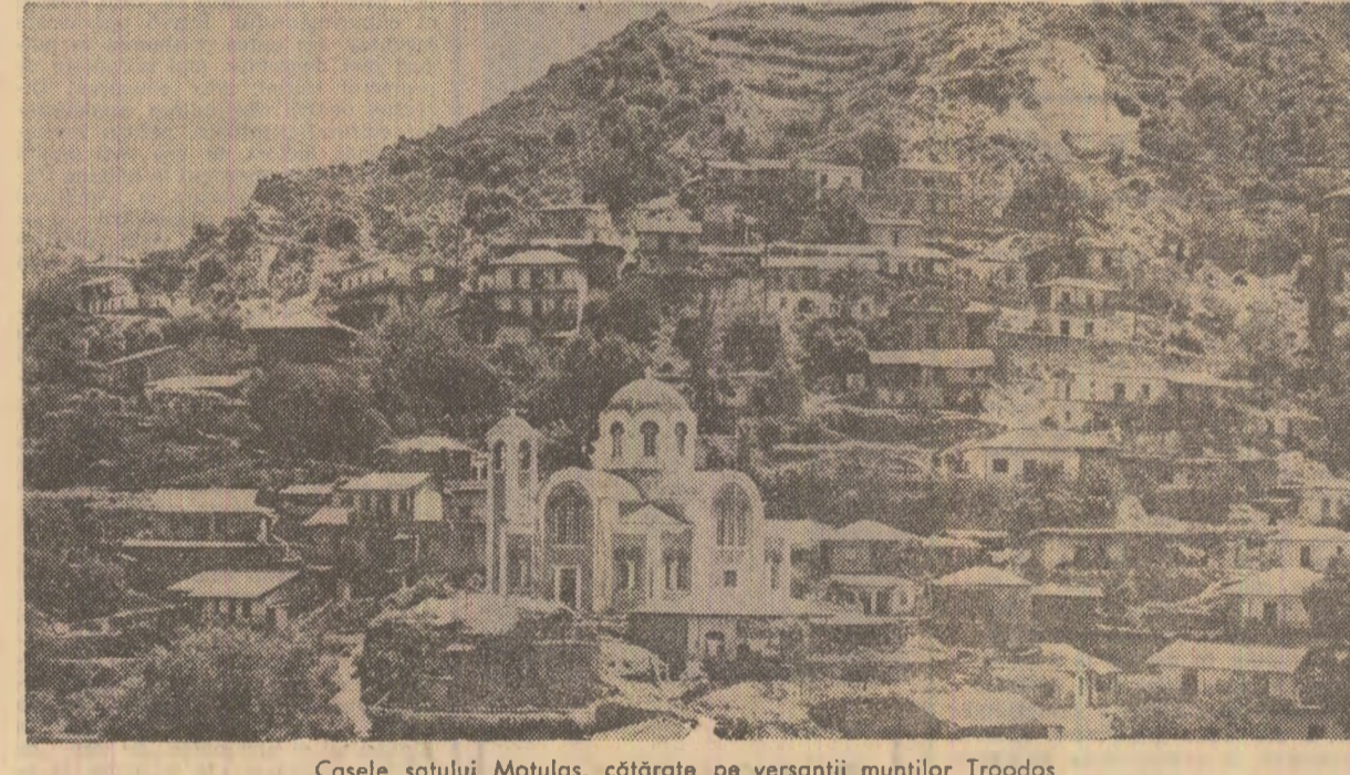
Casele satului Motulas, cîțarate pe versanții munților Troodos

forestiere. Încă cîțiva kilometri și automobilul trece pe sub un arc de triumf pîtrundem în Mudrieh al Tahrir. Înălțate de a ajunge la clădirea administrației provinciei, admirăm cîmpurile verzi, plantațiile de portocali, lămii, viță de vie, grădinițe înflorite, răsărite ca peste noapte în plin desert. Provincia respectivă cuprinde astăzi peste 100.000 de fedani, aproximativ 40.000 hectare, recuperate în urma cîștigării de 400 hectare pe lună din desertul compact care acoperea pînă nu de mult întreaga această regiune. O serie de ferme experimentale au puse, cu mult succes, la dîierite soluții în vederea fertilizării solului, instalînd numeroase stații de irigații în partea cea mai apropiată de Nil. O astfel de fermă experimentală se află în grija unui grup de ingineri și tehnicieni din România. Ac, pe aproximativ 300 de hec-