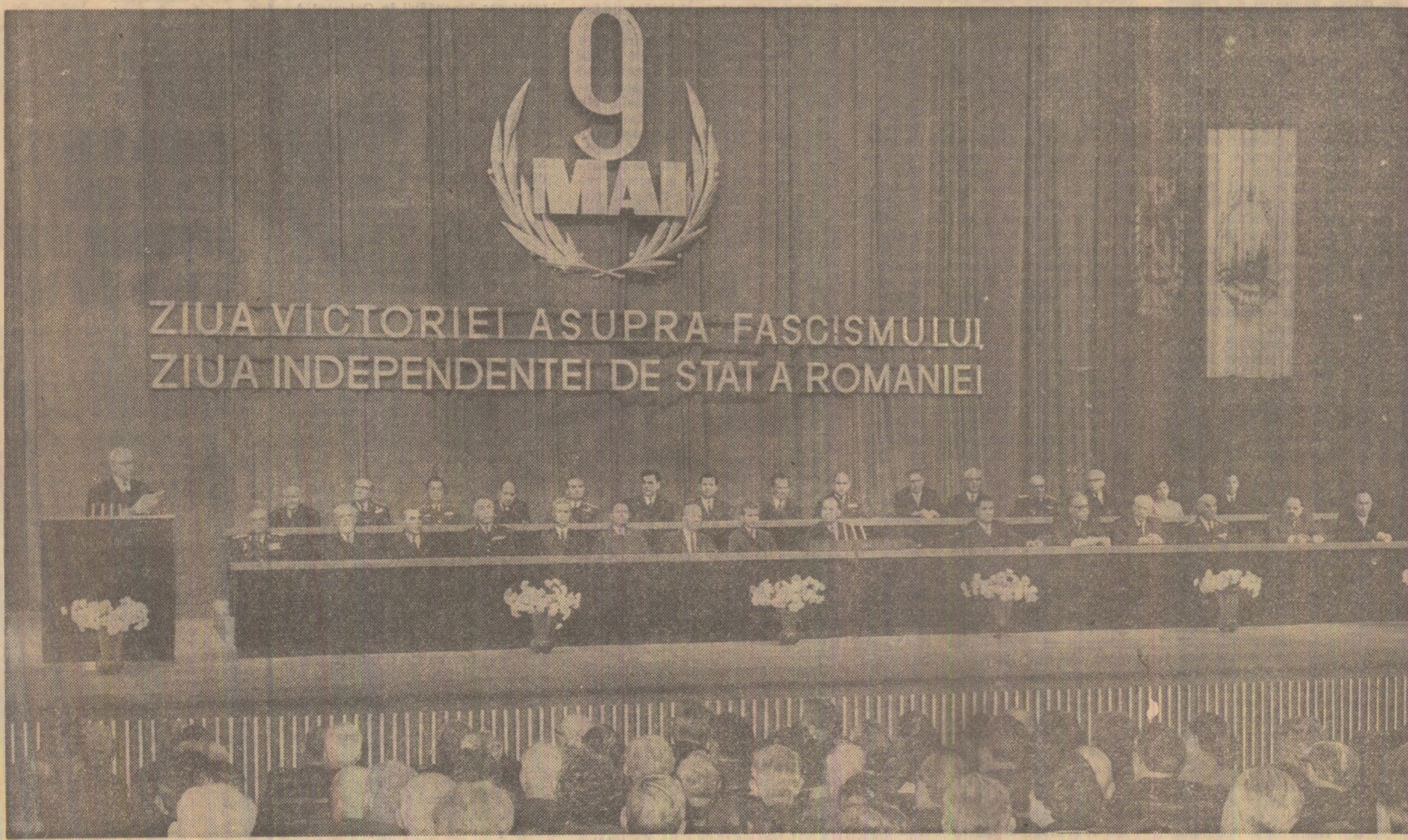
ÎN TIMPUL ADUNĂRII FESTIVE