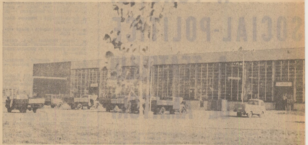
Uzina de reparații auto din Suceava — pe care v-o prezentăm în fotografie — întregeste profilul unei ținare și complexe zone industriale în curs de dezvoltare. Amplasată pe aceeași platformă cu alte noi unități, Uzina de reparații auto, deservită de cadre calificate, dispune de hale spațioase, cu linii tehnologice moderne și standuri de încercare a mașinilor. Colectivul acestei uzine execută reparații capitale la diferite tipuri și mărimi de autovehicule, revizii generale ale motoarelor. De asemenea, aici se pot efectua revizii și reparații la autoturismele hidraulice cu o capacitate de 1,5 și 2,5 tone, precum și alte lucrări de specialitate. Cea mai fină secție a uzinei este cea de construcții metalice.

Prof. dr. C. V. OPREA Institutul agronomic Timișoara