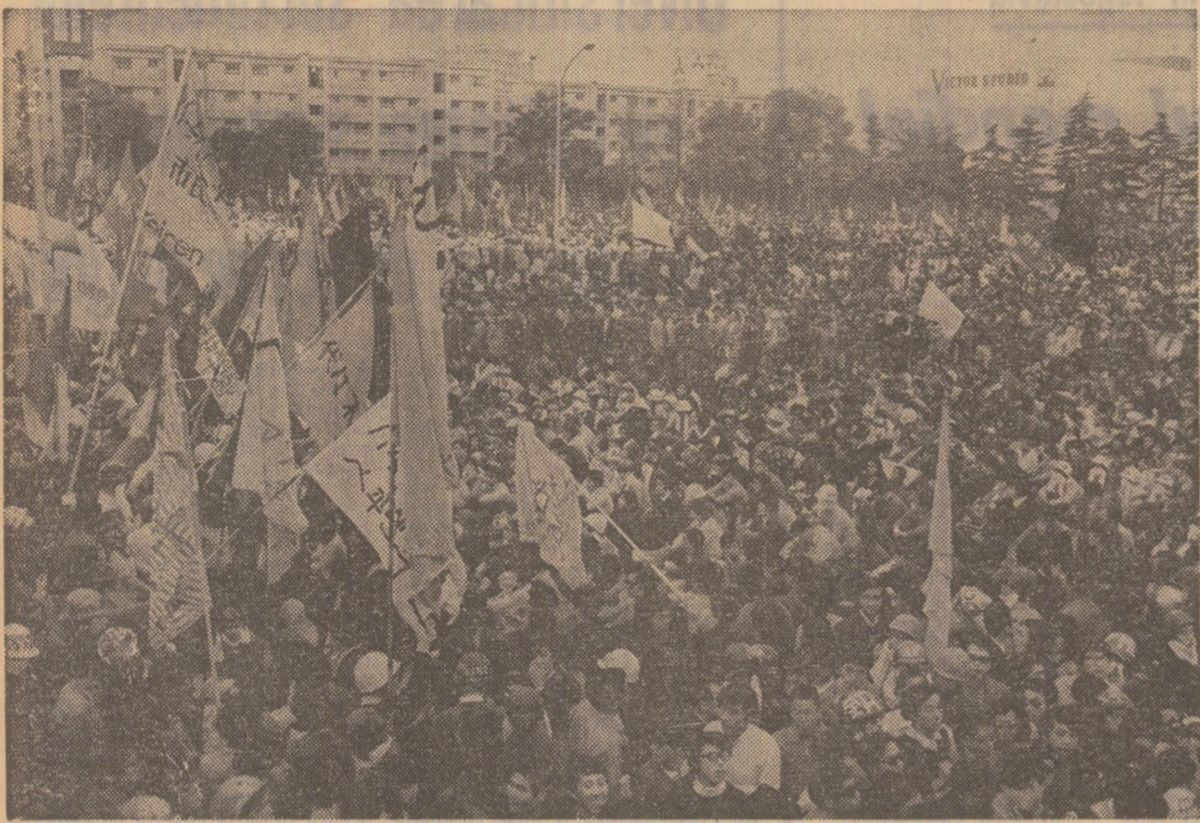
Demonstrația de amploare a oamenilor muncii din Tokio pentru retrocedarea Okinawei către Japonia