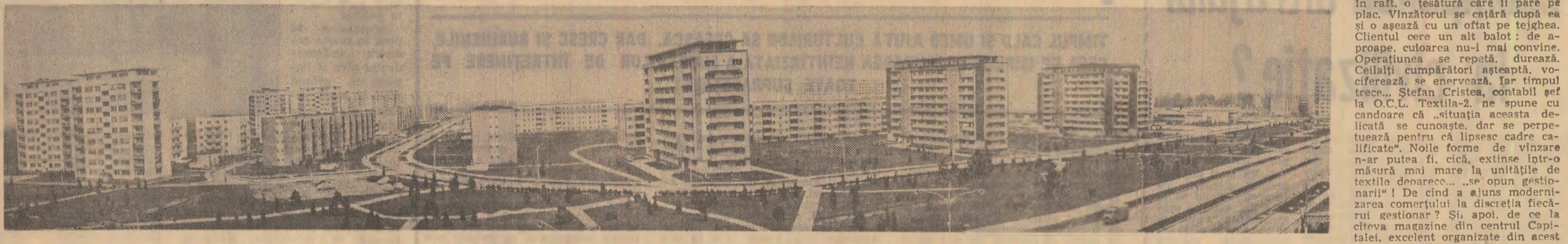
PLOIEȘTIUL ULTIMULUI DECENIU: PANORAMA CARTIERULUI „NORD”