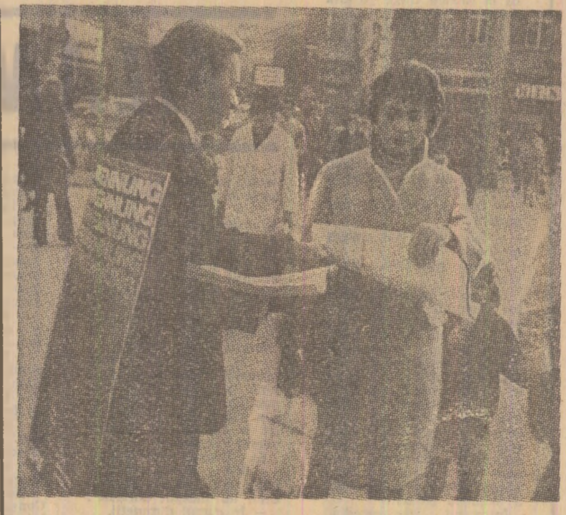
Din inițiativa unor organizații democratice, în diverse orașe ale R. F. a Germaniei se desfășoară acțiuni în sprijinul recunoașterii R. D. Germane și a stabilirii de relații pe baza dreptului internațional între cele două state germane. În fotografie: La Hanovra se distribuie afișe care conțin cereri în acest sens

După cum se vede, în mod paradoxal, regiunile înghețate din nord au devenit în ultima vreme o problemă „caldă” în relațiile dintre cele două țări ale continentului nord-american.