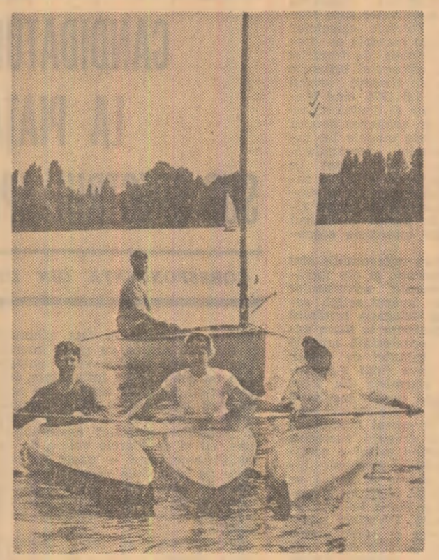
La umbra iahului de tip Fynn — unul dintre cele 15 exemplare construite din plastic la un preț de trei ori mai redus decît al ambarcaunilor similare din lemn — plutesc caiacele „marca” C.N.U.