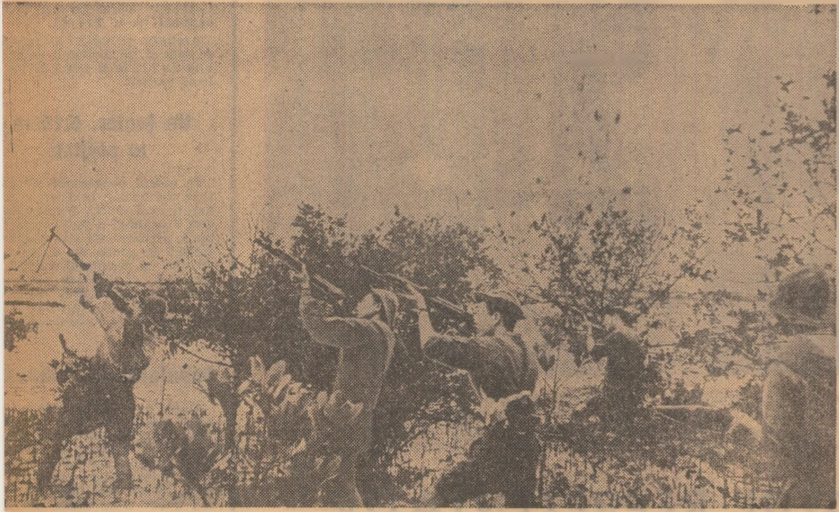
Ostași ai forțelor patriotice din Vietnamul de sud în acțiune în provincia Quang Tri

La Tripoli vor începe săptămâna viitoare tratativele algeriano-libiene, în vederea creării unei companii petrolifere mixte. Această acțiune se înscrie în contextul măsurilor adoptate de cele două țări pentru extinderea colaborării lor în domeniul exploatarea resurselor petrolifere de care dispun și, totodată, pentru definirea unei poziții comune față de companiile petrolifere occidentale.