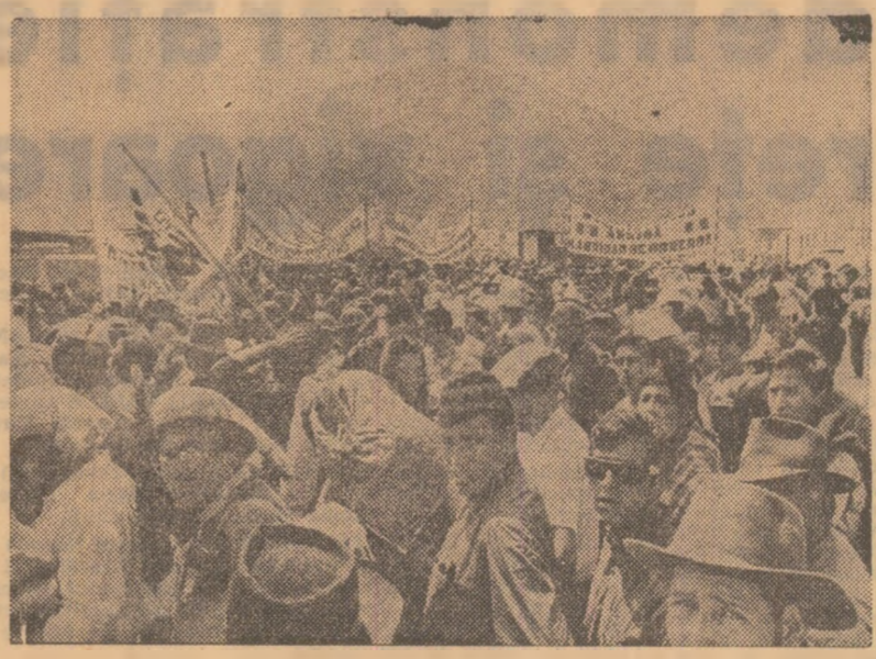
Peru. Manifestație muncitorească la Lima pentru apărarea bogățiilor naturale ale țării, împotriva monopolurilor străine

Calmul a fost restabilit simțită în orașele Bhiwandi, Jalgaon și Mahad din statul indian Maharashtra, unde au avut loc, timp de două zile, ciocniri violente între grupuri de hinduși și musulmani. Potrivit ultimelor știri, în cursul incidentelor dintre cele două comunități religioase și-au pierdut viața 50 de persoane, iar peste 200 au fost rănite. Autoritățile locale au luat măsuri urgente pentru restabilirea ordinii, instituirea unor restricții de circulație.