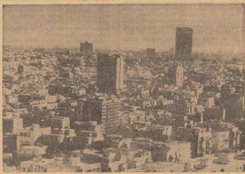
Astăzi este sărbătoarea națională a Israelului — Ziua independenței. În fotografie: vedere din Tel-Aviv

Ministrul de externe al Marocului, Abdelhadi Boutaleb, începe luni o vizită oficială în Marea Britanie. Ministrul marocan va avea convorbiri cu ministrul afacerilor externe britanic, Michael Stewart. Cu acest prilej vor fi abordate probleme referitoare la situația din Orientul Apropiat, relațiile Est-Vest și perspectiva aderării Angliei la Piața comună. Boutaleb va avea, de asemenea, întrevieri cu primul ministru, Harold Wilson, precum și cu liderul opoziției conservatoare, Edward Heath.