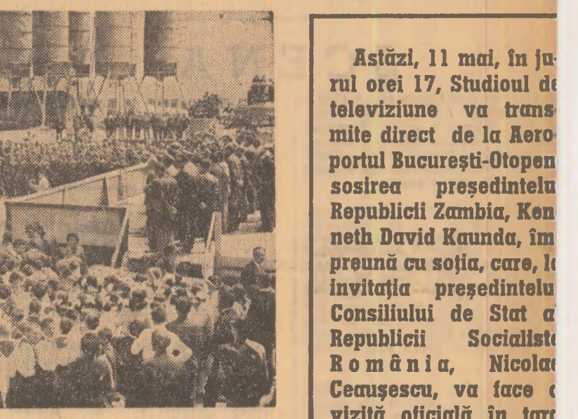
Asăzi, 11 mai, în jurul orei 17, Studioul de televiziune va transmite direct de la Aeroportul București-Otopeni sosirea președintelui Republicii Zambia, Kenneth David Kaunda...