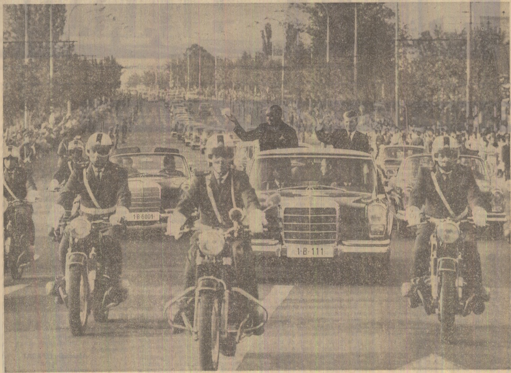
Mii de bucureșteni salută cu căldură pe cei doi șefi de stat

Toasturile roșite de președintele Nicolae Ceaușescu și de președintele Kenneth David Kaunda