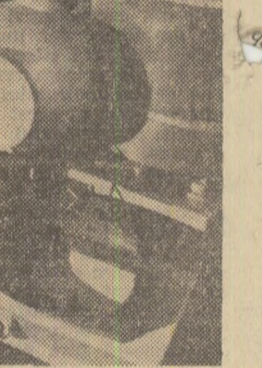
La Institutul geologic din București: cu ajutorul aparaturilor moderne se determină compoziția de minerale utile a probelor

Urmărind succesele evenimentelor în imagini de istorie vie. Succesive încerturi precizează — notînd cite un nume, cite un număr de regiment — identitatea diferitelor personaje, chiar episodice ca o consacrare a eroilor bătailei evocate. Cîteva momente doar depășesc strictetea de documentar a filmului, pentru a contura — colo-