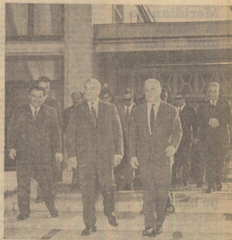
La plecare, pe aeroportul Băneșcu

Luni după-amiază a plecat la Varșovia tovarășul Ion Gheorghe Maurer, președintele Consiliului de Miniștri, conducătorul delegației Republicii Socialiste România la lucrările celei de-a XXIV-a sesiuni a Consiliului de Ajutor Economic Reciproc.