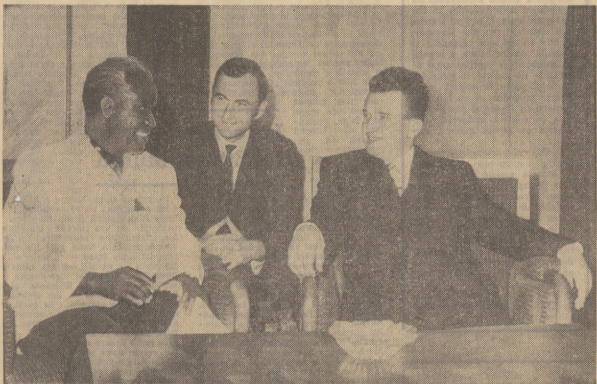
În timpul vizitei protocolare la președintele Consiliului de Stat, Nicolae Ceaușescu