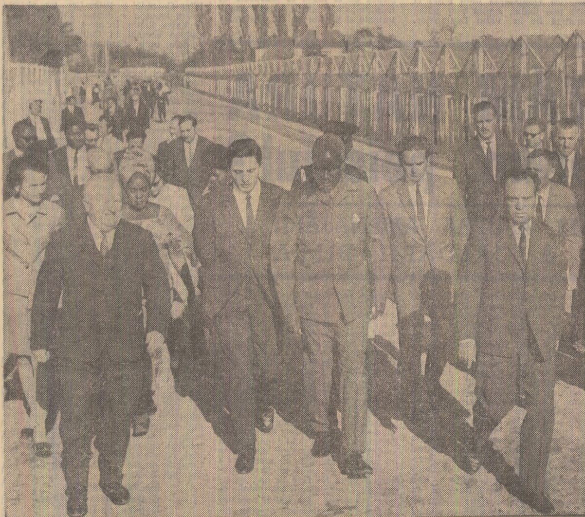
Vizitind serele de la C.A.P. din comuna Otopeni