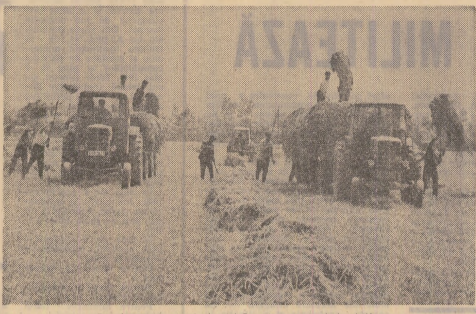
Recoltarea lucernei la I.A.S. Mogoșoaia, județul Ilfov.