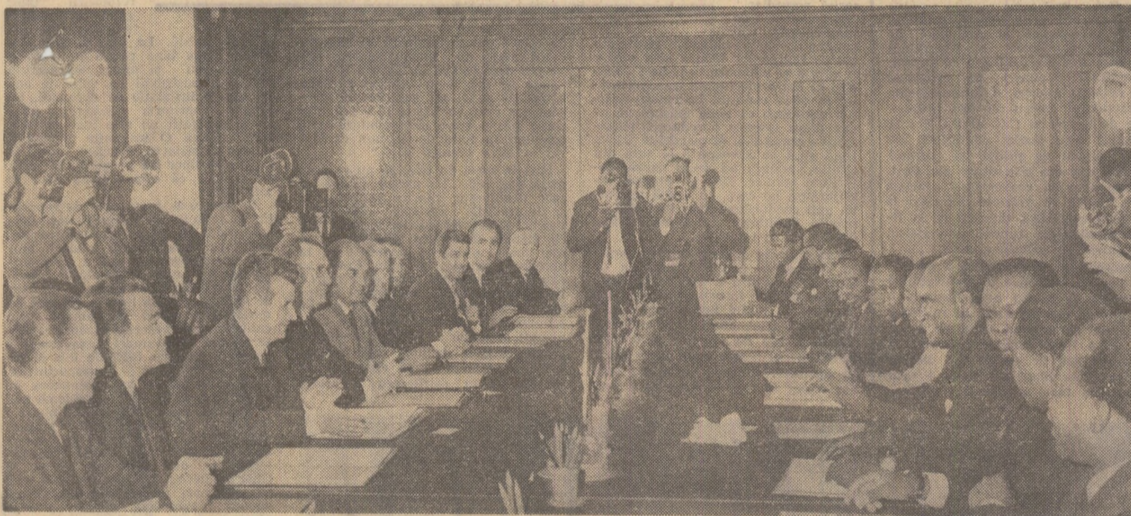
Ieri, la Palatul Consiliului de Stat, în timpul convorbirilor oficiale