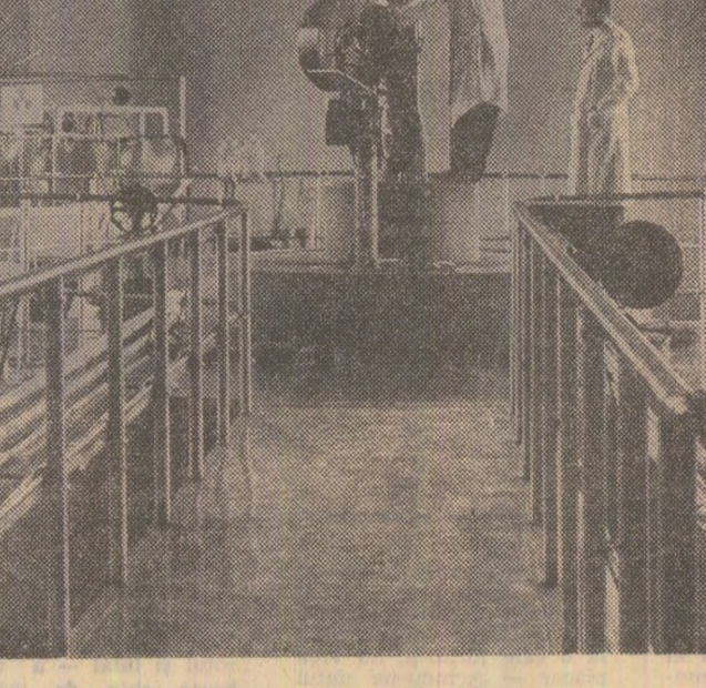
Sala reaktorului nuclear de la I.F.A.