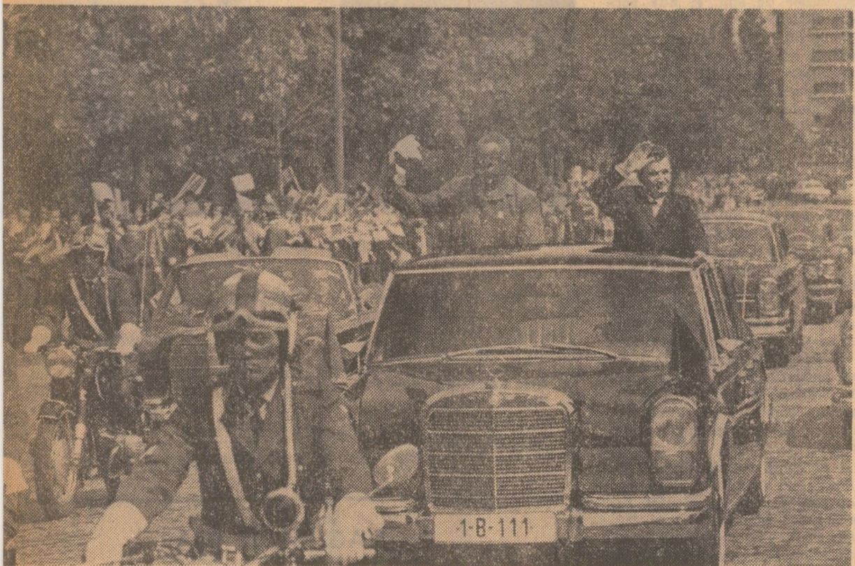
Pe întreg parcursul spre Aeroportul internațional „București-Otopeni”, cei doi președinți răspund aclamațiilor mulțimii

De la bordul avionului, președintele Kaunda a transmis președintelui Consiliului de Stat, Nicolae Ceaușescu, un mesaj în care se spune: Sînt profund impresionat de primirea călduroasă și de ospitalitatea cu care am fost primiți, cu ocazia primei mele vizite în țara dumneavoastră. Părăsim România cu toată admirația noastră pentru dv., pentru țara, guvernul și poporul dv. Este o adevărată experiență să vizitez România. Sperăm că prietenia cu poporul României va deveni mai amplă și folositoare, spre binele celor două țări ale noastre.