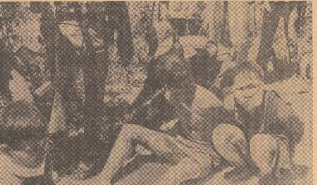
Un „prim interogatoriu” luat unor tineri bănuji de a fi colaborat cu forţele patriotice