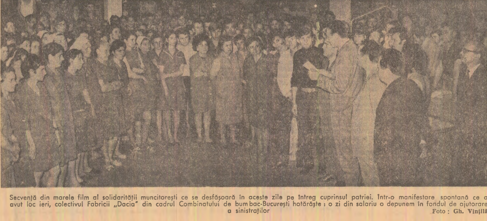
Secvență din marea film al solidarității muncitorești ce se desfășoară în aceste zile pe întreg cuprînsul patriei. Într-o manifestare spontană ce a avut loc ieri, colectivul Fabricii „Dacia” din cadrul Combinatului de bumbac-București hotărâște: o zi din salariul de depunem în fondul de ajutorare a sinistratilor.