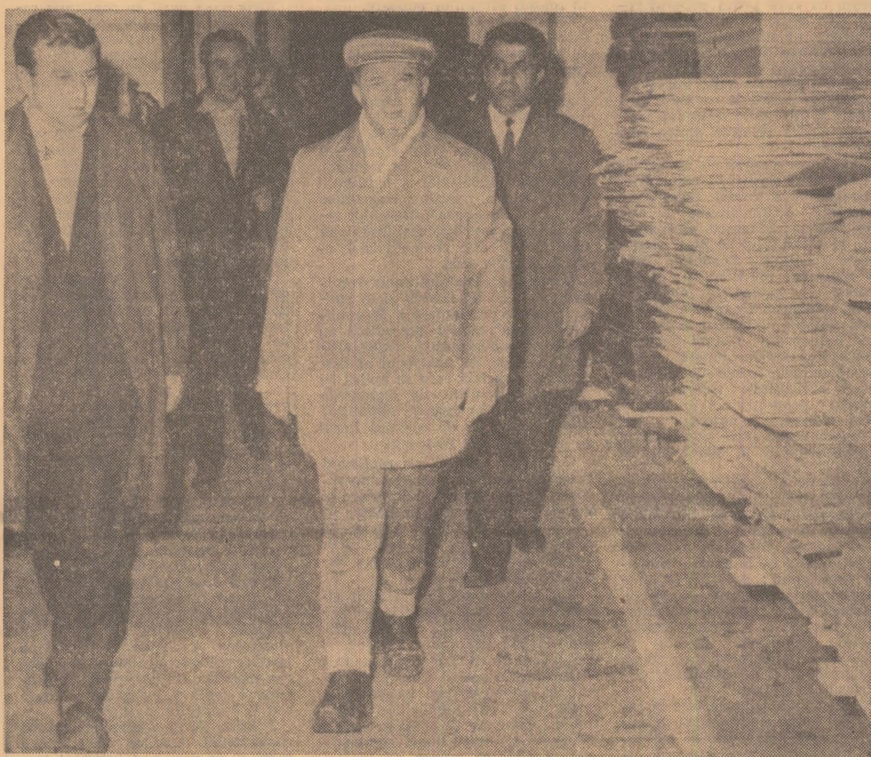
Secretarul general al partidului și ceilalți conducători de partid și de stat vizitează fabrica de mobilă „23 August”, unitate care în scurt timp își va relua activitatea

Cu un elicopter, conducătorii de partid și de stat se îndreaptă spre Valea Mureșului. Încă de departe, ochii surprind o întindere imensă de apă, de un galben murdar care acoperă arături, șosele,