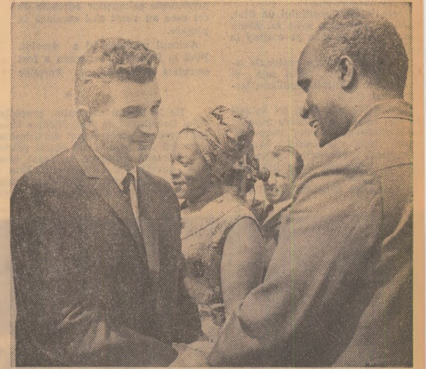
Un călduros rămas bun pe Aeroportul internațional „București—Otopeni”

diplomatice, atașaji militari și alți membri ai corpului diplomatic.