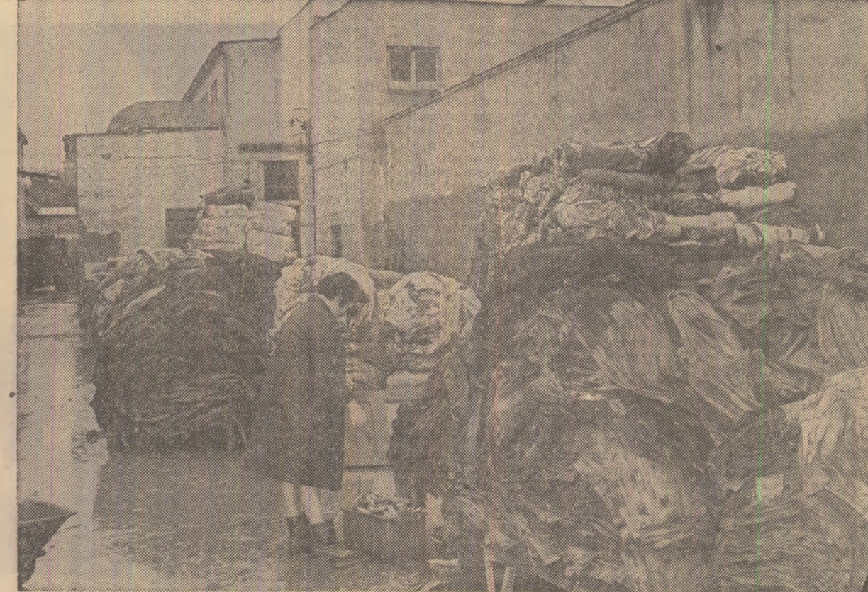
La Uzina textilă „Tirnova” din Mediaș, după retragerea puhoaielor.