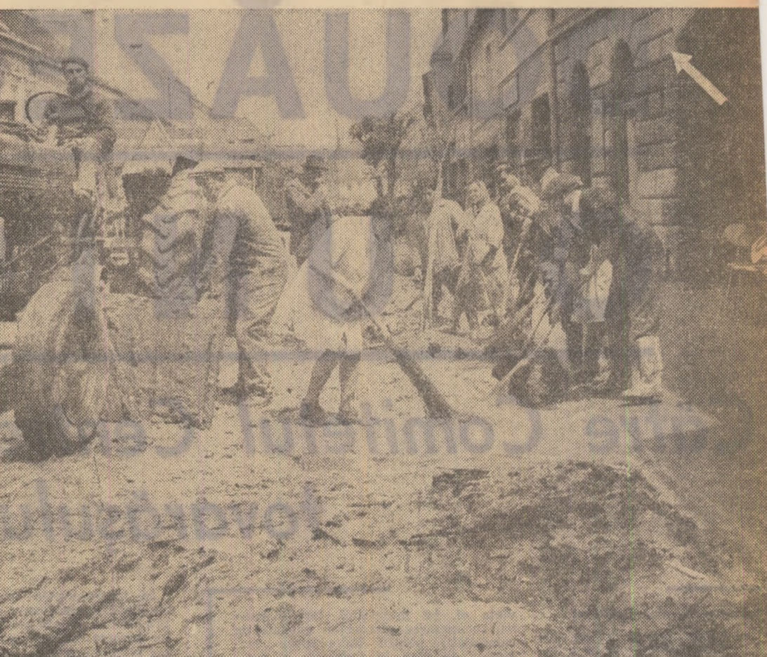
Sighisoara: Se despotmolosc și se curăță străzile. Săgeata arată nivelul ains de ape în timpul in