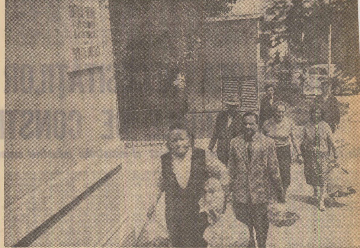
Noi și noi donatori se îndreaptă spre centrele de colectare. În fața centrului din bd-ul Coșbuc nr. 110.