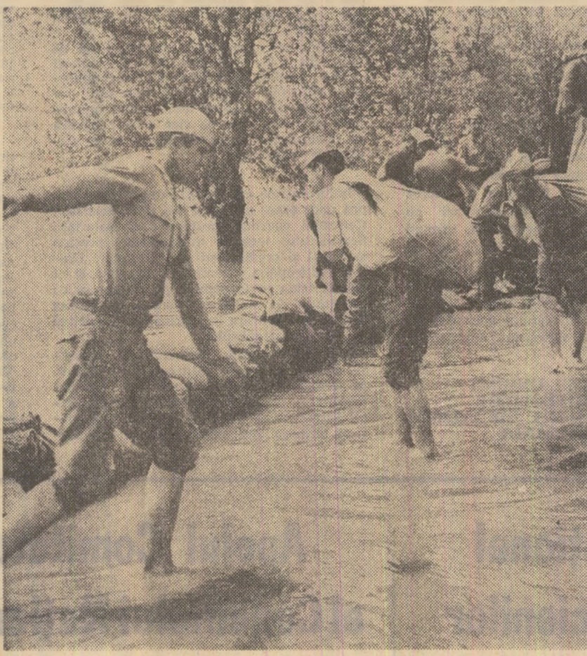
Militari reparînd șoseaua națională în apropierea Nădlacului