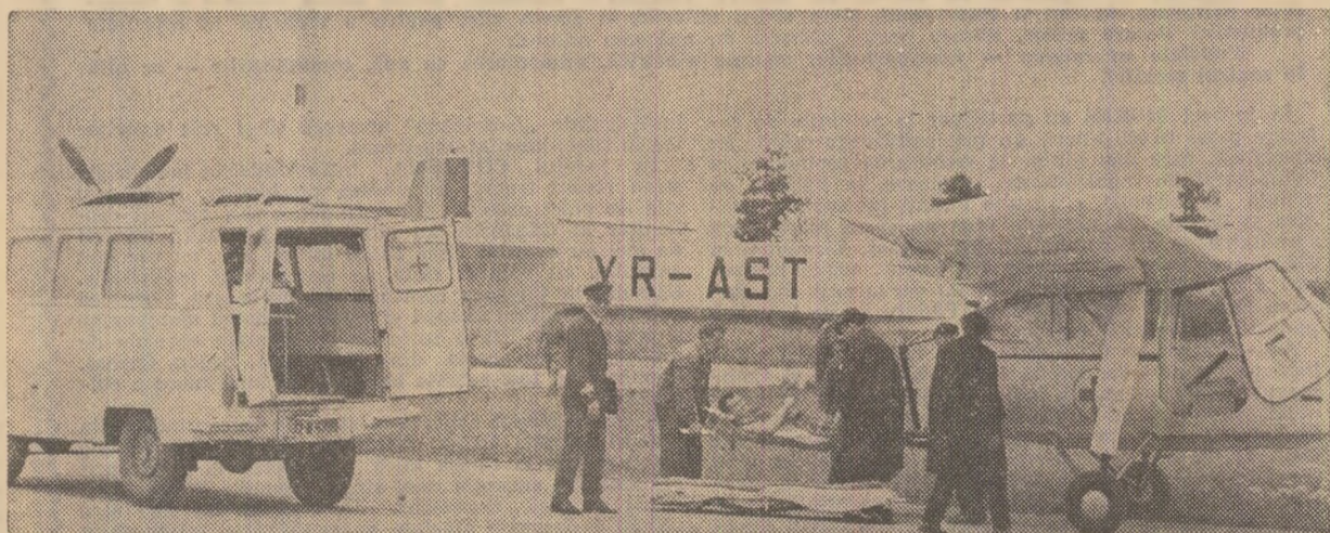
Aeroportul Băneasa: Aviația sanitară a transportat un accidentat grav, din Vrancea sinistrată. Încă un om va fi salvat!

Lucrătorii Ministerului Finanțelor, Bancii de Investiții, Administrației Asigurarilor de Stat, Casei de Economii și Consumațiuni și Administrației de Stat „Loto-Prinosport” au luat hotărîrea de a dărua salariul pe o lună al cadrelor de conducere — și salariul pe o zi, în fiecare lună pînă la sfîrșitul anului, ceilalți salariați, în total circa 1.500.000 lei, în folosul familiilor sinistrate și pentru ocuparea salariaților. Casele de ajutor reciproc ale instituțiilor centrale din sistemul financiar donează din fondurile lor de rezervă 46.000 lei pentru ajutorarea familiilor sinistrate.