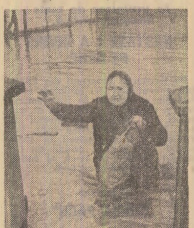
În luptă dramatică cu apele revăr- sate, într-o localitate inundată din Ungaria

BUDAPESTA — Corespondentul Agerpres, Alexandru Pinteș, transmite: Joi dimineața, în dreptul locali- tății Mako din sud-estul Ungariei, în apropierea graniței cu România, a fost înregistrat cel mai înalt nivel atîns vreodată de apele Mureșului pe teritoriul R.P.U. În unele locuri, apa a rupt digurile, revărsîndu-se și pro- vincînd inundații pe întinse suprafețe. Au fost evacuați locuitorii din cîinci comune inundate, așezate de-a lun- gul abiel Mureșului, precum și o parte a populației orașului Mako. Mii de oameni și mașini lucrează neîn- cetat la înlăturarea și consolidarea di- gurilor, la stabilirea apelor. Perico- lul extinderii inundațiilor continuă datorită tendințelor de creștere a ni- velului apelor Mureșului.