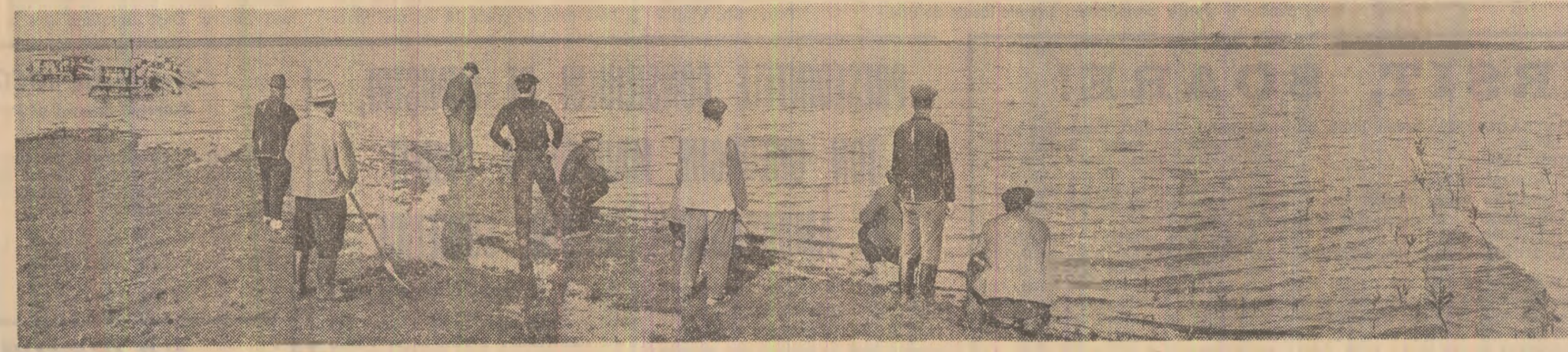
Bărăganul — arhipelag de pămînturi cuprinse de apă