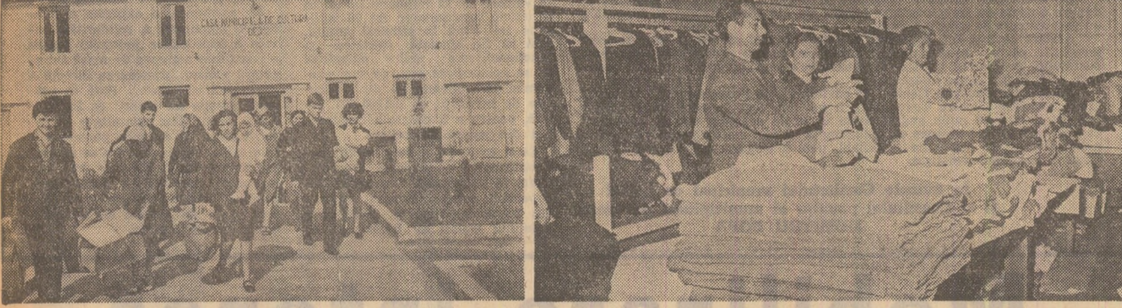
Dej, unul dintre orașele greu încercate. La casa de cultură se primesc și se distribuie darurile trimise de cetățenii patriei în „Contul omniei”