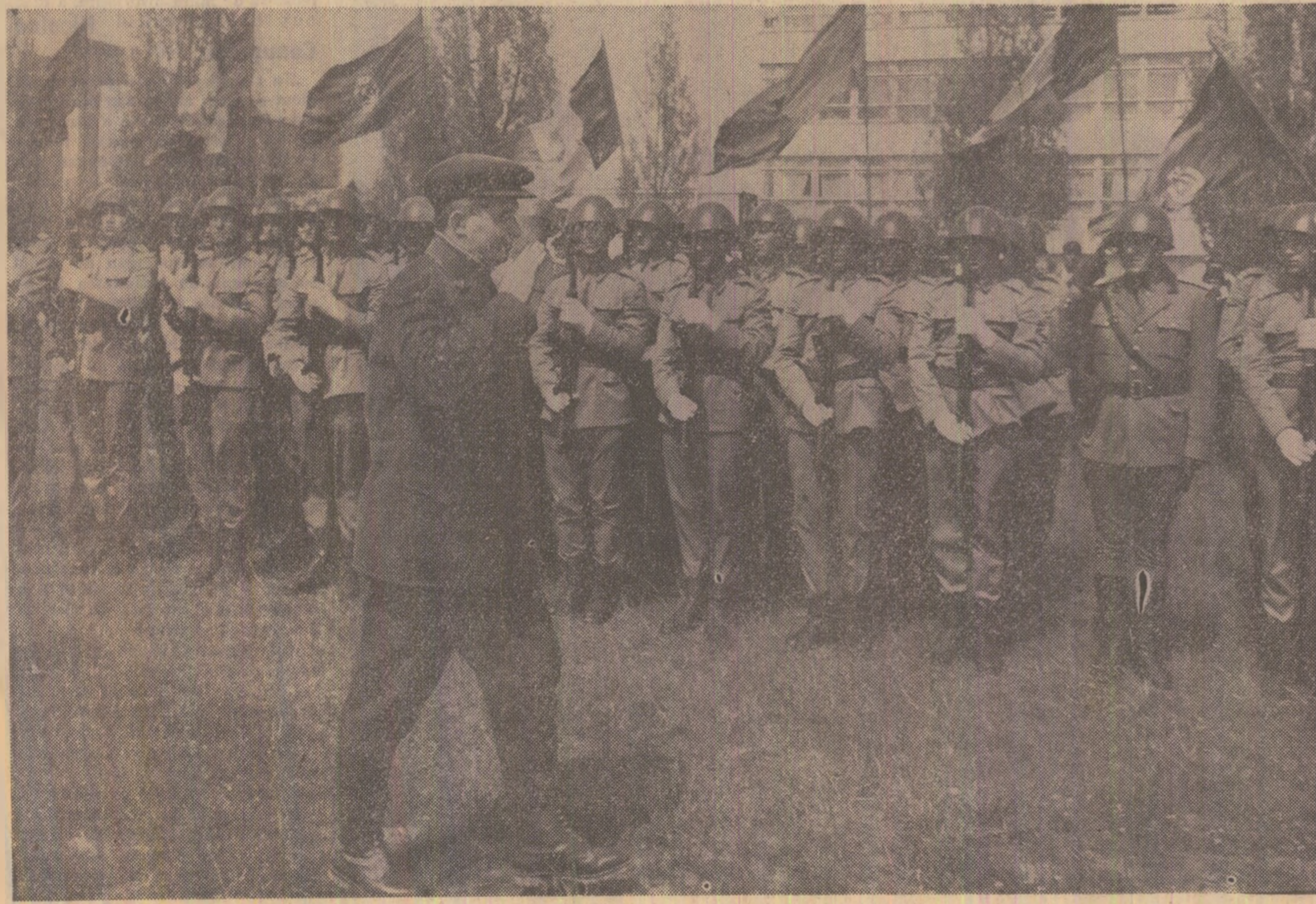
Unități militare dau onorul comandantului suprem al forțelor armate ale Republicii Socialiste România, tovarășul Nicolae Ceaușescu