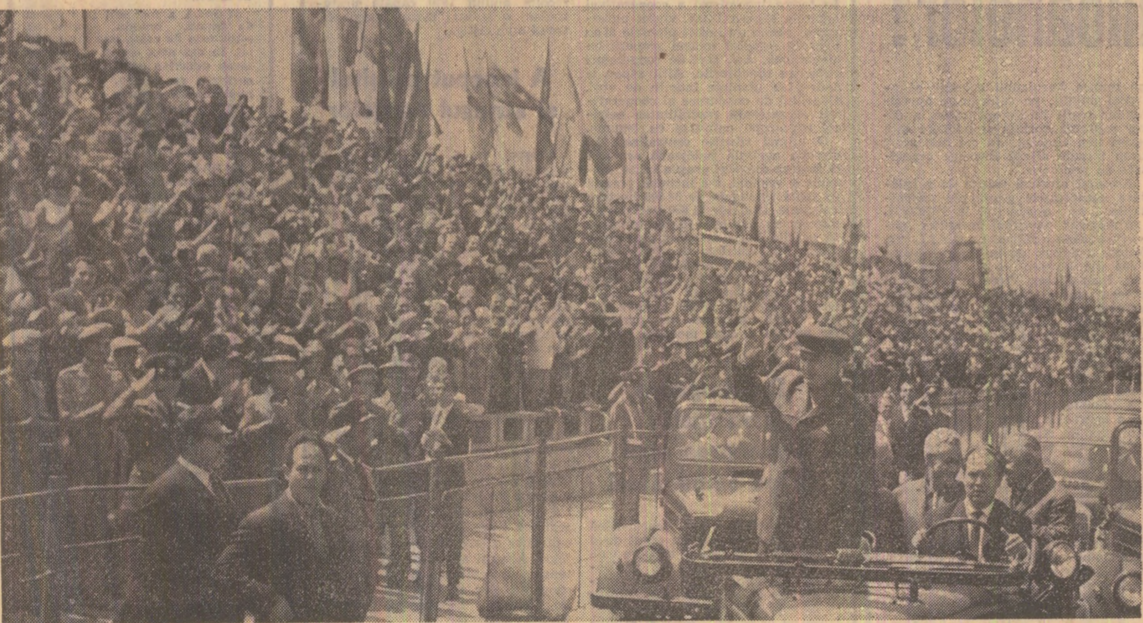
Acclamații nesfîrșite, urale, urări fierbinți de bun venit în vechea cetate de scaun a Moldovei

Colectivele de muncă din întreprinderile și instituțiile județului au hotărît să contribuie la ajutorarea sinistratilor cu o parte din salariu, iar țăranii cooperatori cu sume de bani, precum și cu însemnate cantități de produse agroalimentare. Unitățile industriale și agricole, cetățenii județului Vrancea au donat pînă acum importante sume de bani, precum și 340 tone cereale, 9 tone produse alimentare și peste 43 mii obiecte de îmbrăcăminte și încălțăminte.