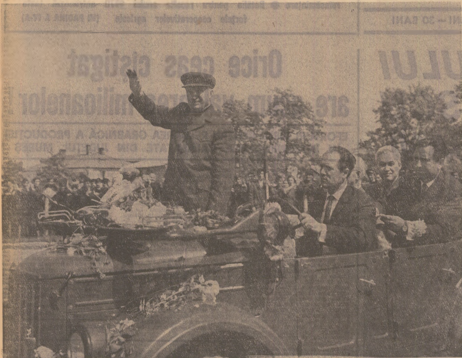
La Botoșani, ca pretutindeni în localitățile vizitate, o primire caldă, entuziastă