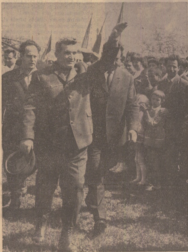
În toate orașele și satele, primire sărbătorească a oaspeților dragi

lui încercat al poporului, Partidul Comunist Român. Stadionul „23 August” de pe dealul Copoului concentrează, în această însoțită dimineață de mai, într-un unic chip, acela al însuflețirii, toate vîrstele, toate profesiile, toate categoriile sociale ale Iașului contemporan. Tovarășul Nicolae Ceaușescu, împreună cu tovarășii Emil Bodnaras, Virgil Trofin, Emil Drăgănescu, Dumitru Popescu, Vasile Patilinej, salută mulțimea care ovaționează. Comandantul gărzii de onoare prezintă raportul. Răsună acordurile solemne ale Imnului de Stat. După ce se înclină în fața tricolorului, președintele Consiliului de Stat, comandantul suprem al forțelor noastre armate, tovarășul Nicolae Ceaușescu, trece în revistă garda de onoare formată din militari, membri ai gărzilor patriotice și ai detașamentelor de pregătire a tineretului pentru apărarea patriei. Adresîndu-se celor de față, tovarășul Nicolae Ceaușescu aduce mulțumiri pentru manifestarea călduroasă făcută pentru conducerea partidului, pentru partid și urează cetățenilor municipiului și județului Iași noi succese în activitatea lor.