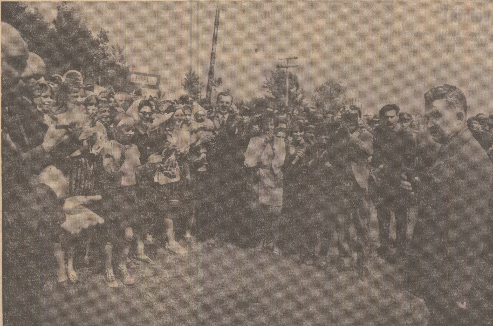
În mijlocul țărănilor cooperatori din Bucecea

Comitetul Central al partidului este convins că oamenii muncii din județul Neamț, din Piatra Neamț vor și în viitor să facă totul pentru îndeplinirea cu cinste a sar-