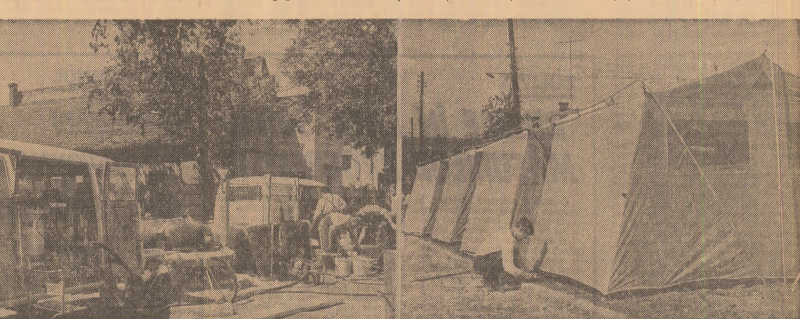
Satu-Mare Instalaţiile de purificare şi filtrare a apelor sînt în plină funcţiune. Cele din imaginea de mai sus au sosit din R. F. a Germaniei...