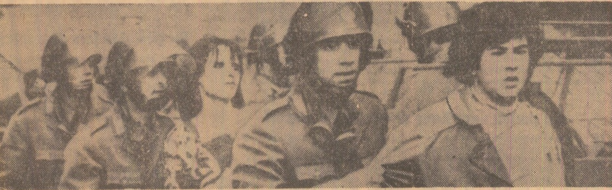
Participanți la demonstrația de protest împotriva N.A.T.O., care s-a desfășurat la Roma, arestați de poliție