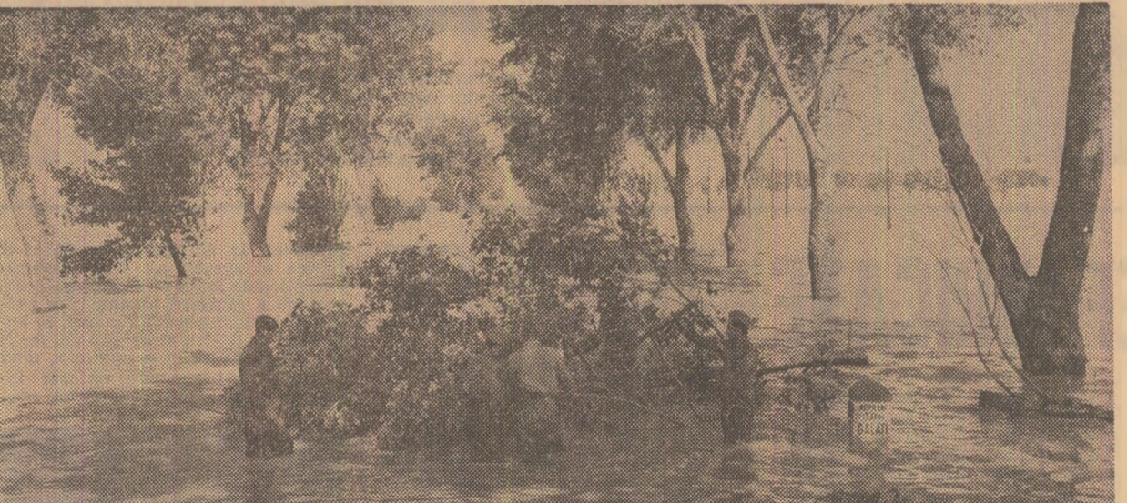
Cumpăna șosea a apelor. Intre Movileni și Calaji (dreapta)