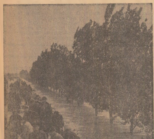
Barajul voinței (la confluența Ialomiței cu Dunărea, mii de oameni apără de furia apelor mîile de hectare semănate cu grâu porumb, floarea-soarelui) (stînga)