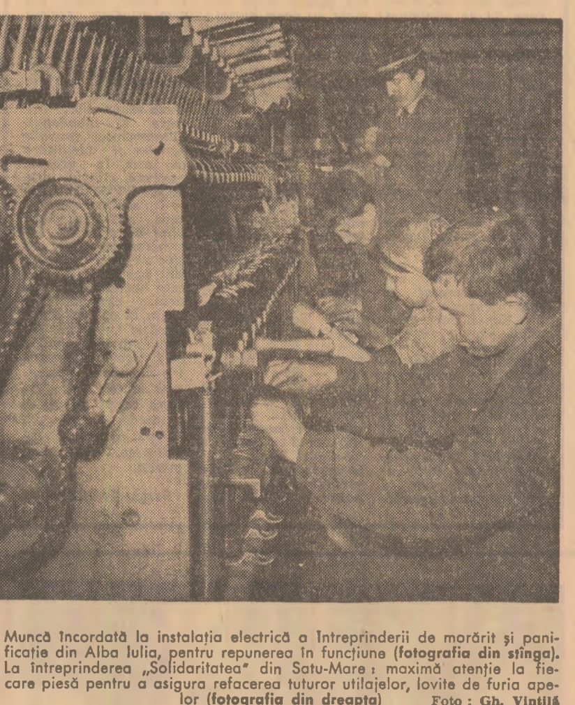
Muncă încordată la instalația electrică a întreprinderii de morărit și panificație din Alba Iulia, pentru repunerea în funcțiune (fotografia din stînga). La întreprinderea „Solidaritatea“ din Satu-Mare: maximă atenția la fiecare piesă pentru a asigura refacerea tuturor utilajelor, luate de furia apelor (fotografia din dreapta)