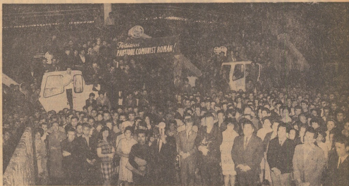
În timpul mitingului de la uzinele „Progresul”-Brăila