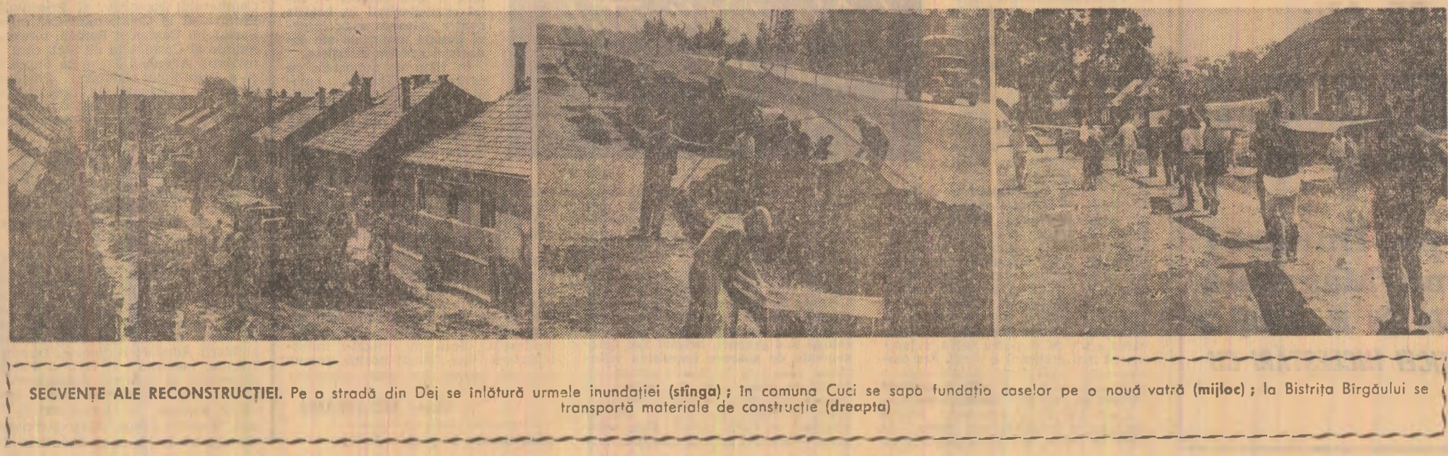
SECVENȚE ALE RECONSTRUCȚIEI. Pe o stradă din Dej se înlătură urmele inundației (stînga); în comuna Cucu se sapă fundația caselor pe o nouă vatră (mîjloc); la Bistrița Birgăului se transportă materialele de construcție (dreapta)

— Din dispoziția comandamentului de prevenire și combatere a efectelor inundațiilor, constituit pe minister, la „Electromures” și „Automecanică” s-au deplasat — pentru a lua parte nemijlocit la reluarea în funcțiune a acestor unități — peste 140 de muncitori de înaltă calificare din alte întreprinderi, precum și cîțiva specialiști din minister. Tot aici, din diferite uzine constructoare de mașini au fost dirijate, de asemenea, 6 grupuri elec-