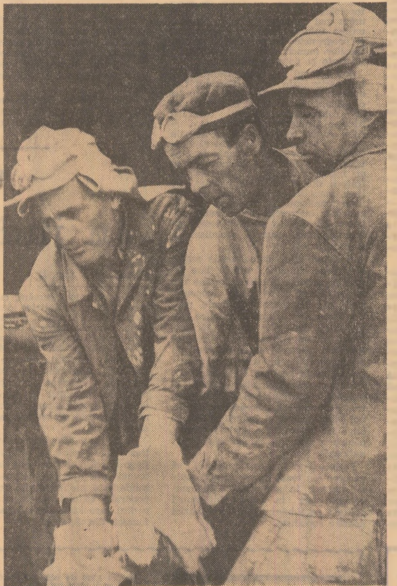
Trei ca unul...