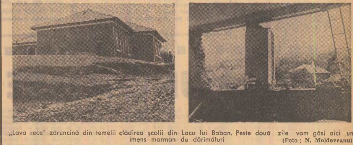
„Lava rece” zdruncină din temelii clădirea școlii din Lacu lui Baban. Peste două zile vom găsi aici un imens morman de dărîmături

Același factor care a provocat catastrofele inundații — extraordinară cantitate de precipitații abătută asupra majorității teritoriului țării — a fost și la originea unei alte calamități naturale, alunecările de teren. Sute de locuințe cu și fără funcții publice s-au dărîmat drept urmare a deplasării masive a solului, multe altele au fost avariate, s-au prăbușit strîcaciuni pe traseele căilor de comunicații, precum și alte pagube însemnate de natură economică. Din ferice, datorită procesului relativ lent de alunecare, nu s-au semnalat niciunde victime omenești. În județul Bacău au fost afectate în mod deosebit de această calamitate orășul Tirgu Ocna și satele comunei Bîrsănești. În raza întregului județ numărîndu-se peste 600 de case distruse, pagube au suferit și satele Bătea, Silivaș și Sic (județul Cluj), comuna Geogiu