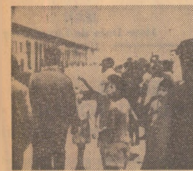
Ravagii și panică după cutremur