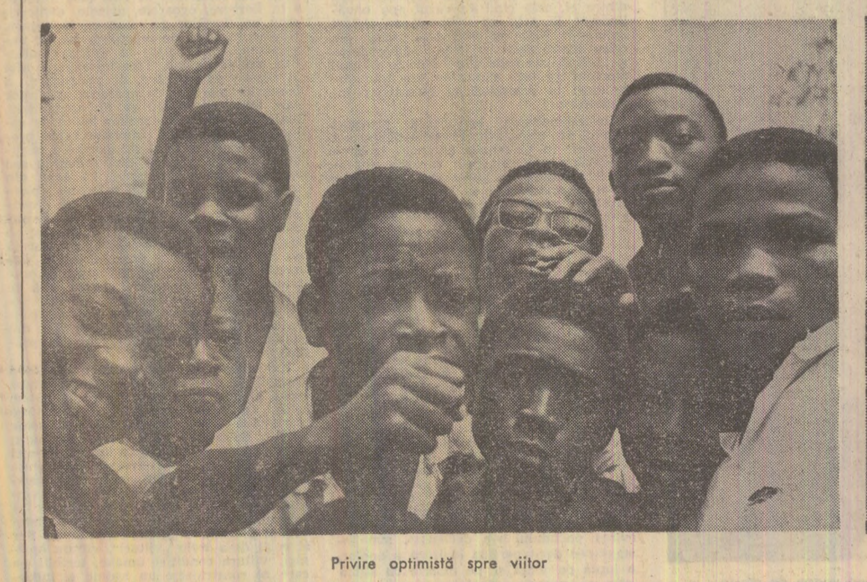
Privire optimistă spre viitor

le de pescari, ngalawe, cum sînt denumite în lim- ba swahili. Iată o astfel de ambarca- țiune fragilă trecînd pe lin- gă un cargobot transocea-