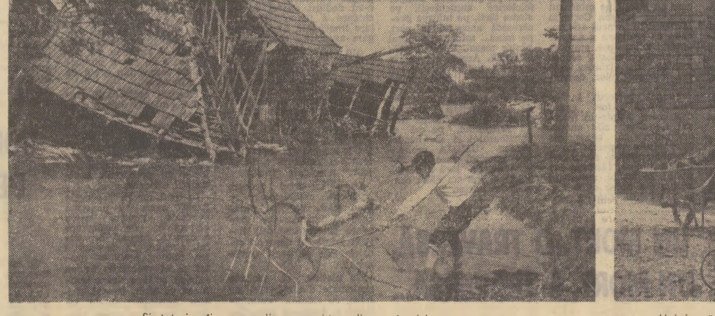
Și, totuși, mine, copacii se vor ridica din nou în picioare