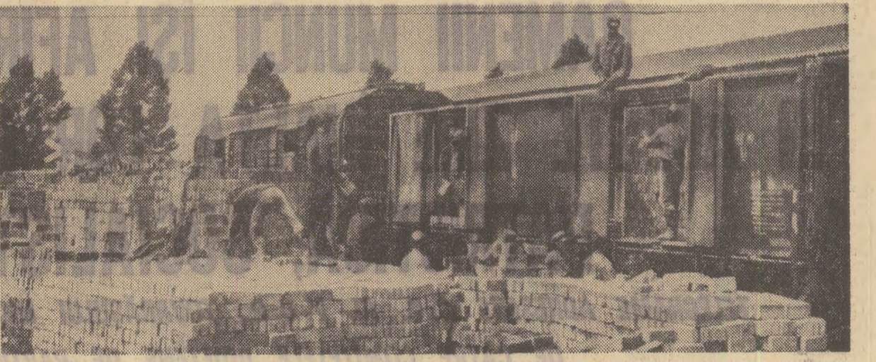
Se descarcă materiale pentru noile locuințe destinate sinistraților

Ștefan DINICA, corespondentul „Scînteii”