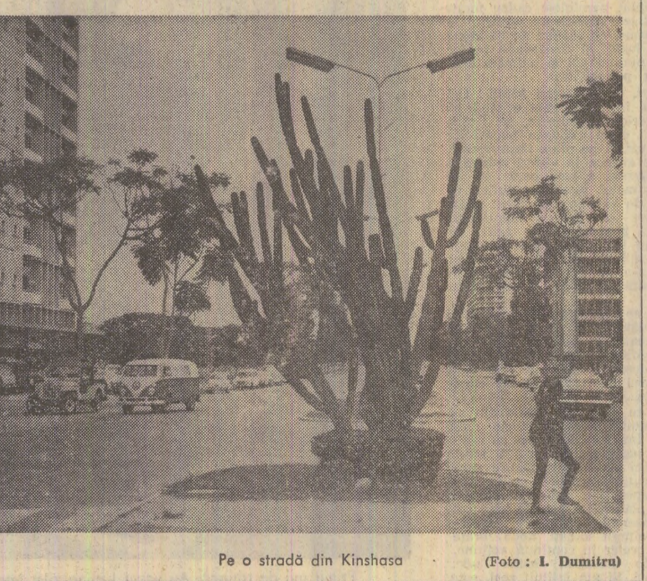
Pe o stradă din Kinshasa