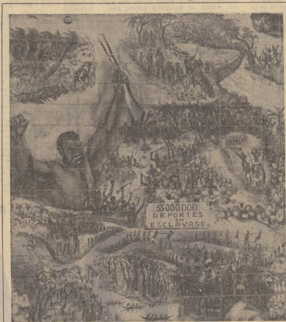
Brazzaville: Frescă simbolizînd lupta de eliberare a Africii (fragment)

Insemnări dintr-o călătorie de 20 000 km prin AFRICA de George IONESCU