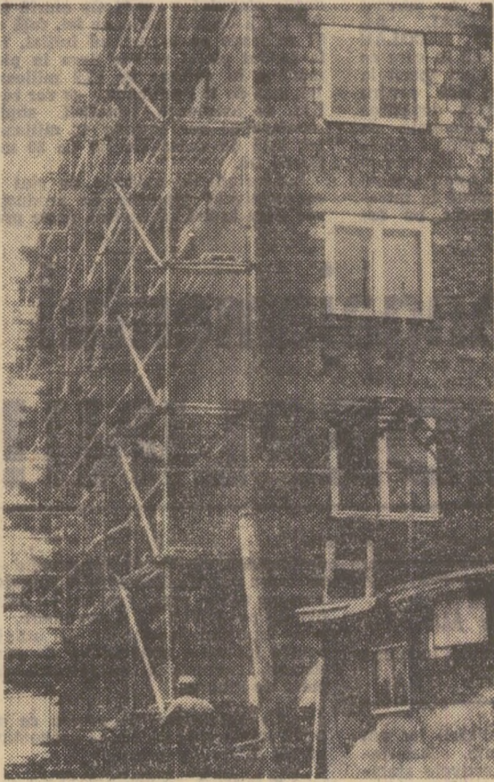
Dej: Bloc de locuințe finisat în interior și dot în foloșință sinistraților