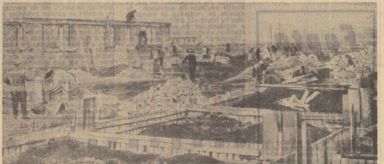
La Cătești, județul Mureș, cooperativii sinistrați își ridică noile locuințe