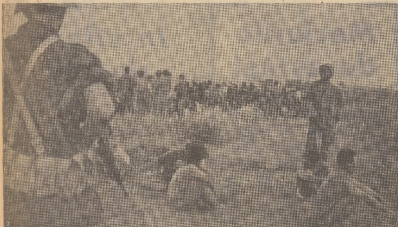
Locuitori pașnici ai Cambodgiei sub amenințarea mitralierelor. O imagine devenită obișnuită pe pământul acestei țări, încalcat de trupele agresoare

Lon Nol a trimis noi întăriri în satul Setbo, forțele de rezistență populară, și-au consolidat pozițiile deținute, menționând agenția U.P.I. Citind declarația unei oficialități de la Pnom Penh, agenția Associated Press transmite că s-a creat o situație deosebit de grea pentru trupele generalului Lon Nol. In regiunea de nord-est, detașamente de patrioți au ocupat orașul Lompkat, capitala provinciei Ratanak Kiri.