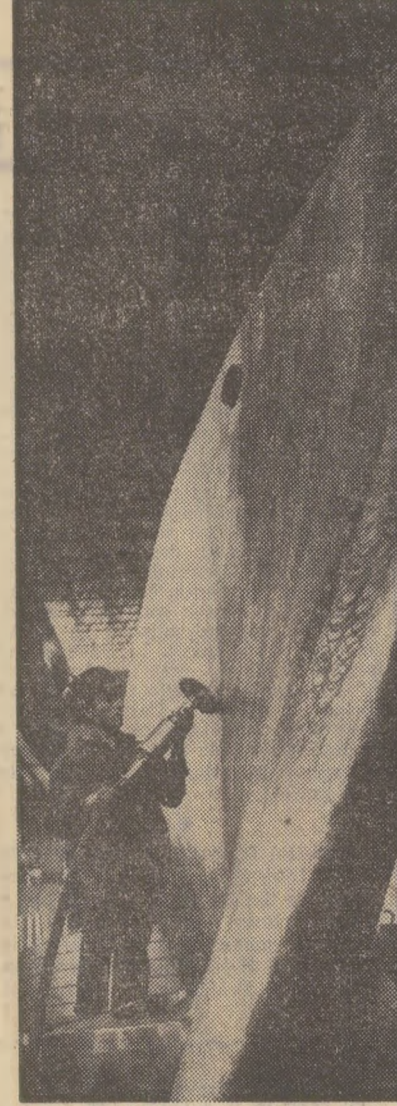
În aceste zile, în fabrici și uzine, pe marile șantiere de construcții, în mine se muncește din plin, eric, pentru îndeplinirea sarcinilor de plan și a angajamentelor asumate în întrecere. În fotografia din stînga: se curăț și se slefuiesc paletele ce vor fi montate în sala turbinelor a hidrocentralei de la Porțile de Fier; în fotografia din dreapta: ultimele verificări la o mașină de alezat și frezat produsă la Fabrica de mașini-unelte și agregate din Capitală

Uriașă concentrare a eforturilor tuturor colectivelor de întreprinderi în cursul lunii mai, efectuarea de schimburi suplimentare și schimburi prelungeți, valorificarea, pe această cale, a rezervelor interne la un nivel superior și-au găsit reflecția în obținerea unei producții suplimentare de circa 70 milioane lei, față de 40 milioane lei cît reprezentă producția suplimentară realizată în medie în primele 4 luni ale anului. Industria Brașovului a pus la dispoziția economiei naționale, peste prevederile planului pe 5 luni, 563 tone oțel, 1761 tone îngrășăminte azotoase, peste 300 tone metanol, 26 autocamioane, 20 tractoare, 30.000 rumeni, 1.100 tone ciment, 81.000 metri pătrați țesături etc. O contribuție deosebită la depășirea planului și a angajamentelor pe județ au avut uzinele de tractorare și cele de autocamioane, „Rulmentul” combinatelor chimice din Făcărăș și Victoria, Fabrica de hîrtie Ghimbav ș.a.