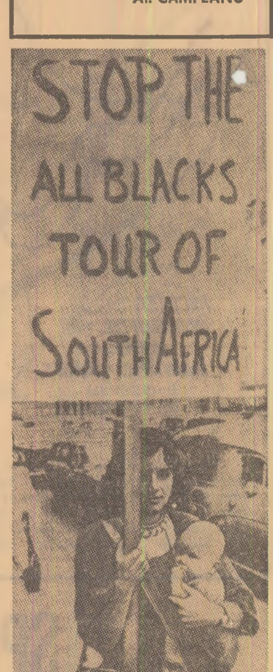
Picheta de demonstrații în fața ambasadei Noii Zeelande din Londra. Manifestanții cer contramandarea turneului echipei de rugby a Noii Zeelande în Republica Sud-Africană

De la corespondentul nostru AI. CAMPEANU