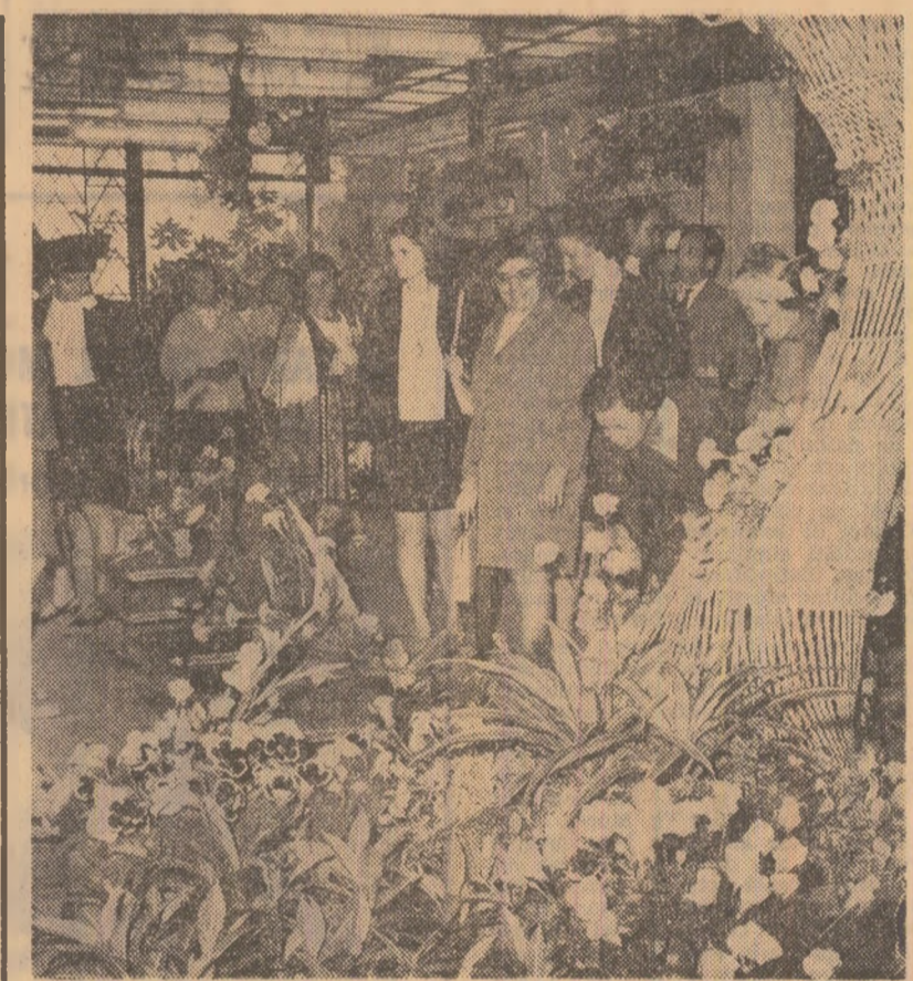
La expoziția de flori deschisă în Parcul Herăstrău din Capitală

ma lui să aperse ceva de dincolo de propria lui alcătuire. Nu și-ar fi uitat tată și mamă să scoată străin din suvoi, nu și-ar fi uitat nevastă și copii de-acasă cînd a pus pieptul, în oraș străin, să lînă talazul. N-ar fi luat vitura în cap dacă n-ar fi știut că malul trupului său păzește o alcătuire și că această alcătuire e făcută din oameni de seama lui. A țesut, de dincolo de ape, alcătuirea — aceasta mai strîns ca altădată. Așa sint, la picioarele podului, cimenturile acelea pe care apa le face mai virtuose. Căci ce sintem oare noi toți, la urma urmei, decît alcătuirea unui mare pod, boltit de mîini meștere, dinspre trecut către viitor, și care se întărește după fiecare izbitură și crește după fiecare puhoi?