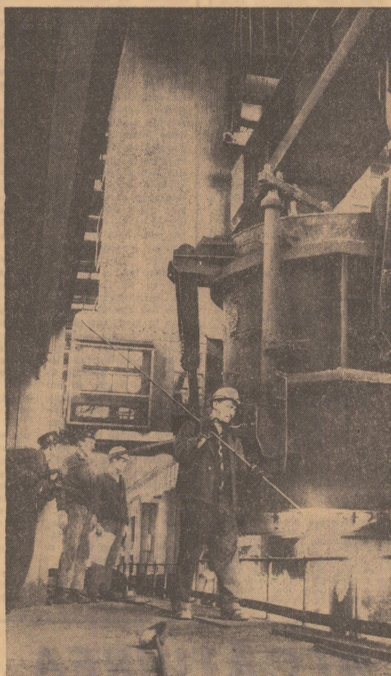
O nouă țară la Combinatul siderurgic din Galați

Din Capitală și de la Reșița, de la Suceava și Constanța, de la Piatra Neamț și Pitești, din multe alte localități ale țării, reporterii și corespondenții noștri ne-au transmis, ieri, numeroase relații despre munca rodnică desfășurată în fabrici și uzine, pe ogoare. Și în duminicile trecute, din dovadă de înaltă conștiință patriotică și cetățenească, sute de mii de oameni ai muncii au lucrat ca într-o zi obișnuită, spre a contribui la recuperarea într-un timp cât mai scurt a pagubelor provocate economiei de calamități, la sporirea producției industriale și agricole. A fost cu adevărat o „duminică în haine de lucru”.