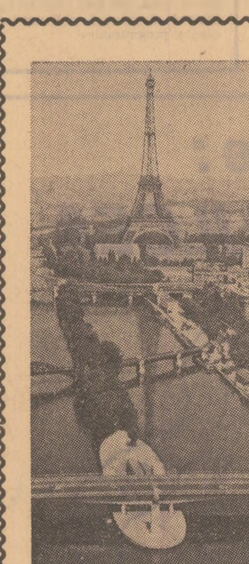
Parisul se transformă. În jurul Turnului Eiffel, simbolul imuabil al Capitalei franceze, au început să se ridice construcții impresionante. Marurile Senei oferă astfel, puțin cîte puțin, imaginea pe care urbaniișii încearcă să o dea Parisului de mine

La o săptămîină după cutremurul catastrofal care a avut loc în Peru este încă imposibil să se evalueze cu precizie pagubele. Potrivit unor cifre oficiale, numărul morților este de 30.000. După alte aprecieri, între care și datele oferite de UNICEF, circa 50.000 de persoane și-au pierdut viața. În ce privește numărul răniților, se crede că a ajuns la 15.000, dintre care 2.000 în stare gravă. Se apreciază, de asemenea, că aproximativ 800.000 de persoane au rămas fără locuință. Industria peruviană este greu lovită, numeroase întreprinderi fiind distruse total sau parțial. Din diferite țări au sosit primele ajutoare — hrană, medicamente, îmbrăcăminte și diferite materiale — destinate sinistratilor.