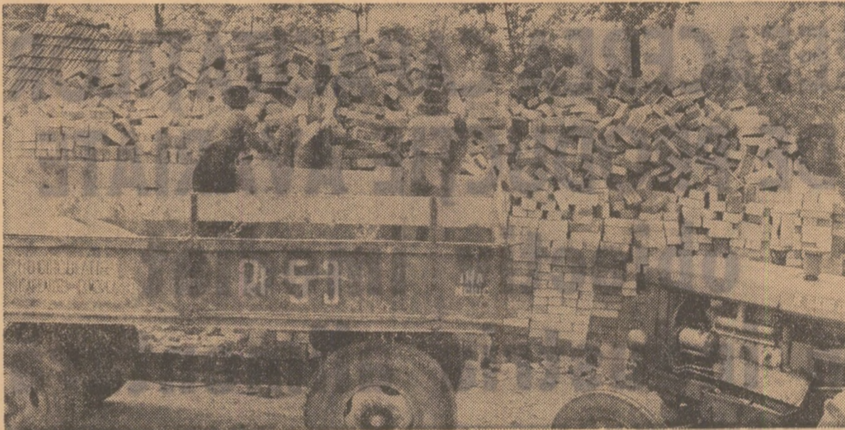
Județul Mureș; se descarcă materiale de construcție