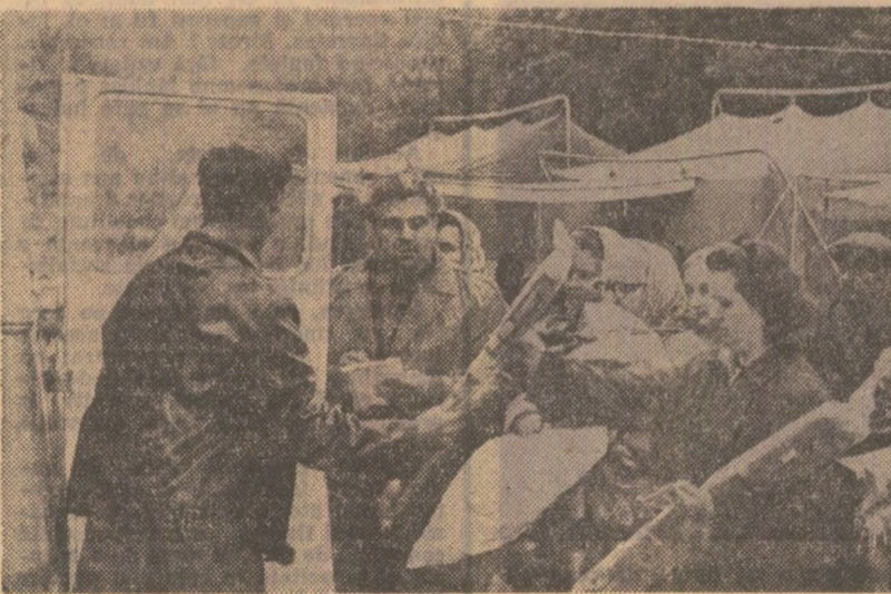
Impărțirea ajutoarelor — pături și saltele sosite din Iugoslavia — sinistraților din Lipova